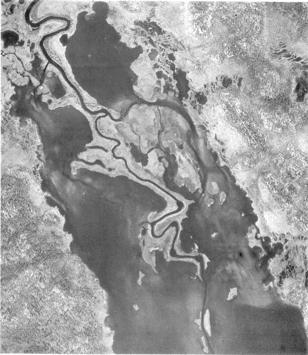
Fig. 3. Luftfotografi av undersøkelsesområdet. September 1951.