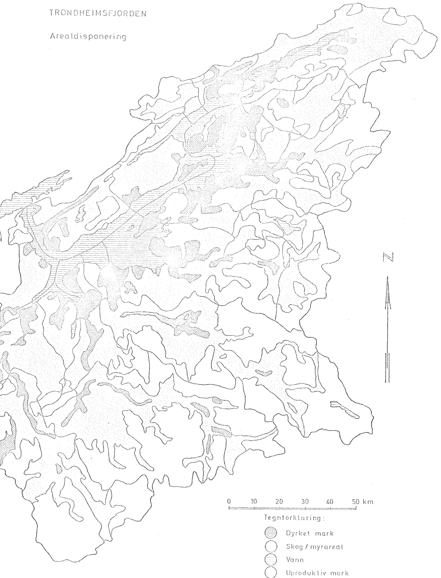
Fig.1 TRONDHEIMSFJORDEN Arealdisponering