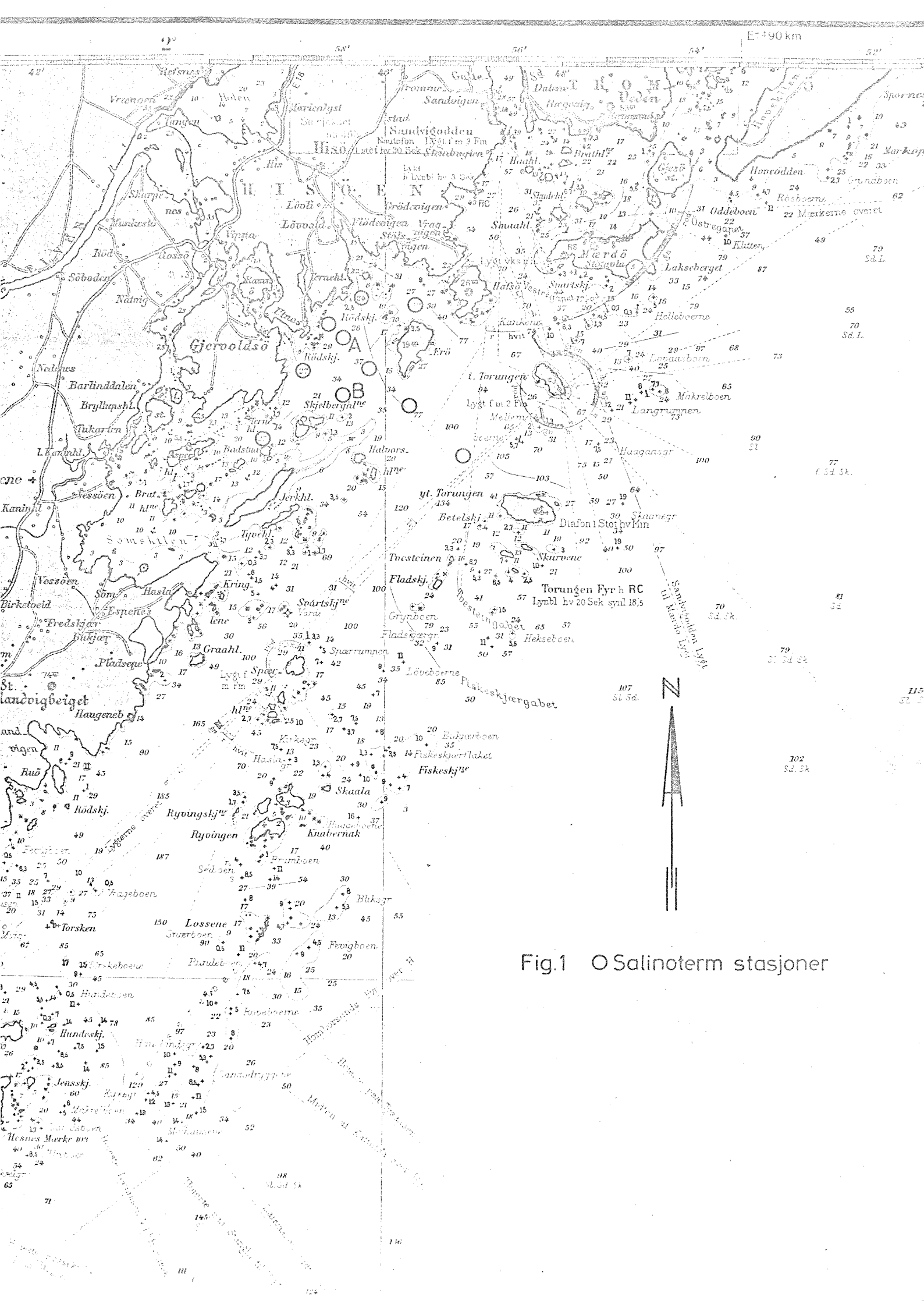
Fig.1 O Salinoterm stasjoner