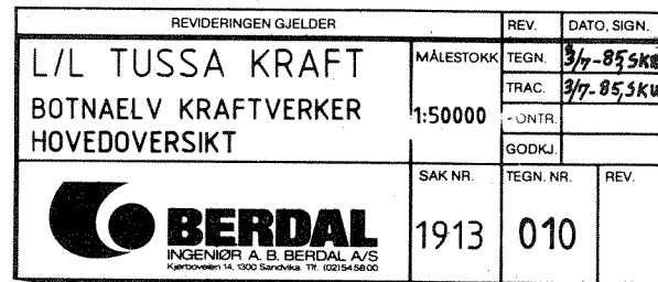
Fig. 1 Oversiktskart