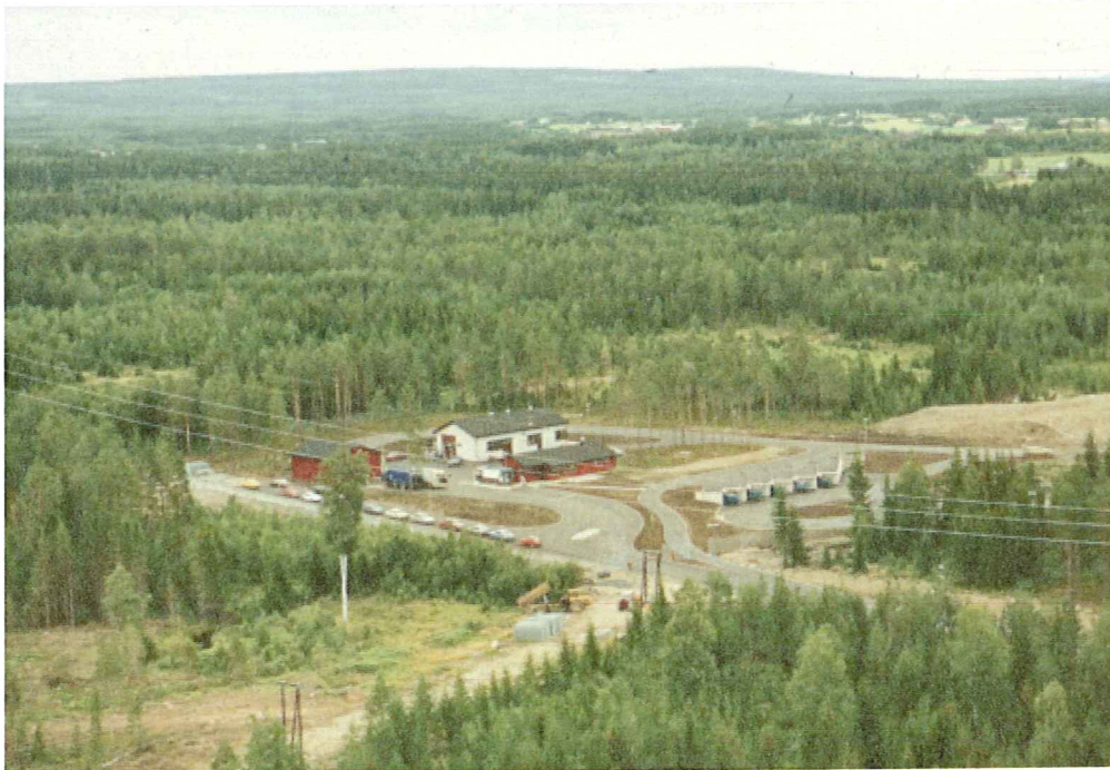
Flyfoto av Heggvin avfallsplass

Sluttrapport for undersøkelser i 1998 og 1999