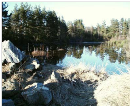
Figur 1. Grunnvann ved Nomelandshola

Deponiet ligger i flatt terreng langs riksveien og mellom vegstasjonen og et lite kalt Nomelandshola (se figur 1). Sigevann fra deponiet står sannsynligvis i kontakt med tjernet. Det er vanskelig å angi dreneringsretning for sigevannet, men det kan observeres at grunnvann trenger ut under foten av veien inne på nikkilverkets deponiområde (se figur 4). Vi har antatt at dette vannet kommer fra området omkring vegstasjonen og dermed deponiet. Deponiet er anlagt i en tidligere naturlig fordypning i terrenget uten bunntetting. Deponiet er i dag overdekket slik at intet avfall er synlig.