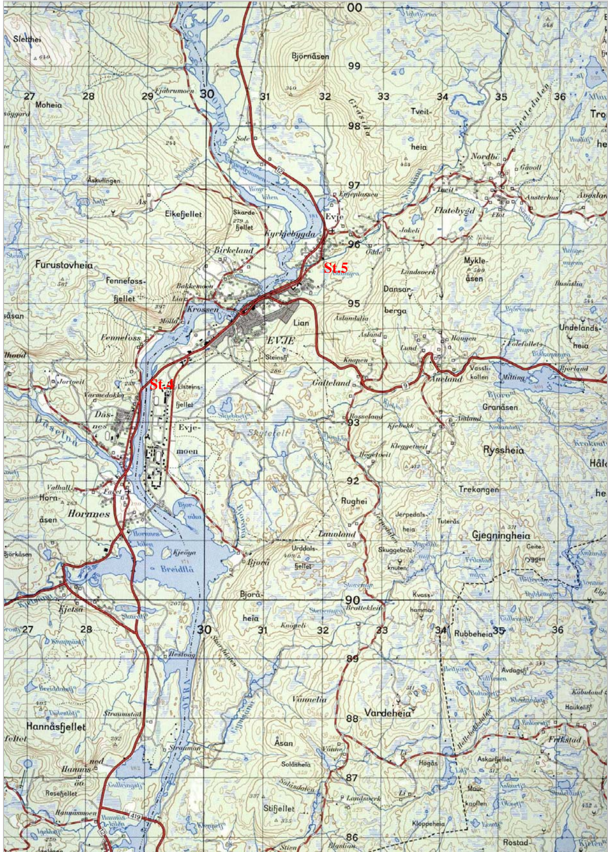
Figur 6. Områdekart med markering av prøvetakingsstasjoner.