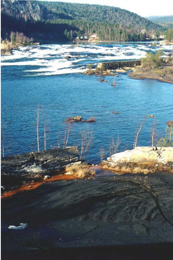
Figur 5. St.2. Sig over betongdam, sør