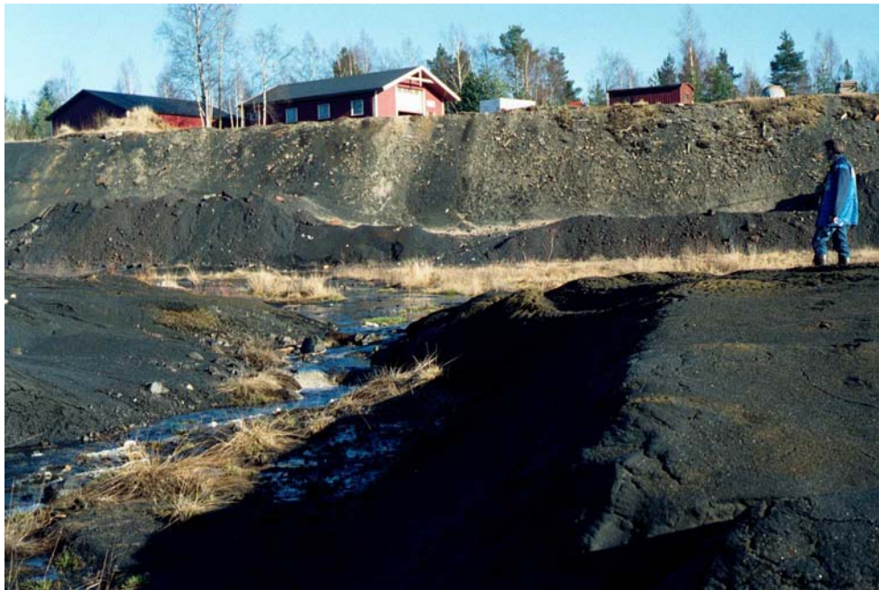
Figur 4. Grunnvannsstrøm under veg (den nordligste bekken).

Etter samtaler med kjentmann (N. Bydal) ble det vurdert slik at deponiene er av mindre betydning da de kun har vært i drift under en kort tidsperiode (kommunalt blandet avfall) og relativt små mengder avfall har vært deponert. Det ble foretatt en inspeksjon av skråningen nedenfor deponiet nedenfor Felleskjøpet. Intet unormalt ble observert. Videre undersøkelser av disse deponiene ble ikke utført.