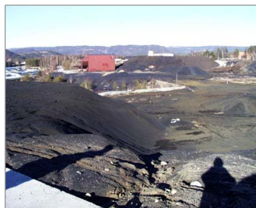
Figur 2. Oversikt over Verksmoen

På dette området sto det under nikkilverkets driftstid en smeltehytte for kobber/nikkel. Malmen ble fraktet ned fra gruvene ved Flåt for røsting og smelting av metall. Slagget fra smelteprosessen ble i de første driftsår tappet i bøttelignende støpeformer slik det ofte var vanlig på den tid. En tipp av den såkalte bøtteslaggen ligger fortsatt igjen på området der smeltehytta sto. Senere ble slagget granulert og deponert i hauger på stedet. Etter nedleggelsen av nikkilverket i 1946 overtok Øgrey Industrisand området med slagget. Etter rensing av slagget ble det produsert blåsesand og sand som ble benyttet til belegg på takpapp. Det ble også importert en del granulert slagget fra andre kilder bl.a. fra Kolaområdet til denne produksjonen. Importert slagget ble deponert på det samme området. Området er presentert på figur 1 og figur 2.