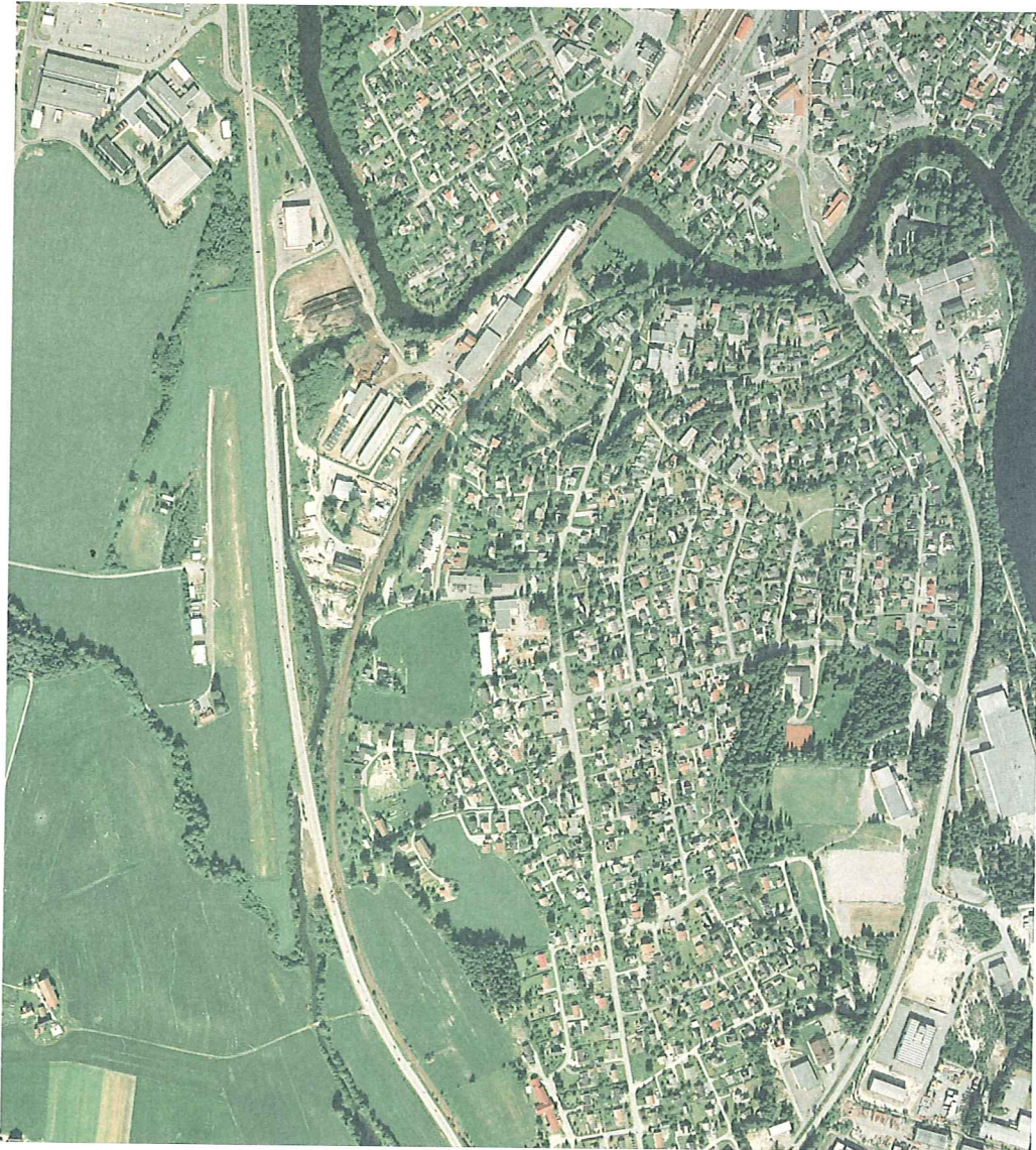
Figur 4. Øvre del av Loeselva. Flybilde tatt 5.7.1997. Målestokken er justert til ca. 1:10 000.