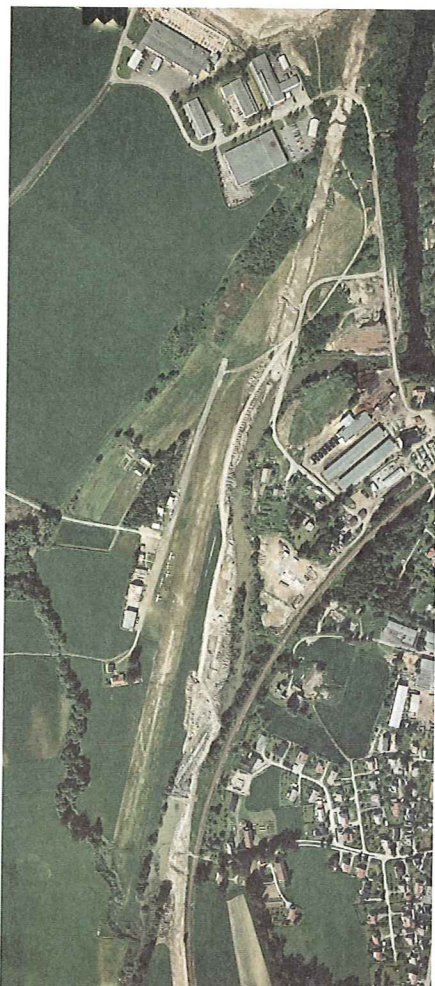
Figur 3. Øvre del av Loeselva. Flybilde tatt 29.6.1987. Målestokken er justert til ca. 1:10 000.