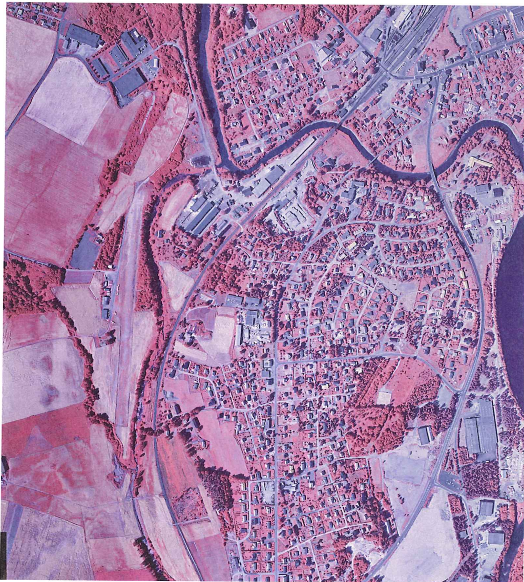
Figur 2. Øvre del av Loeselva. Flybilde tatt 2.8.1982. Målestokken er ca. 1:10 000.