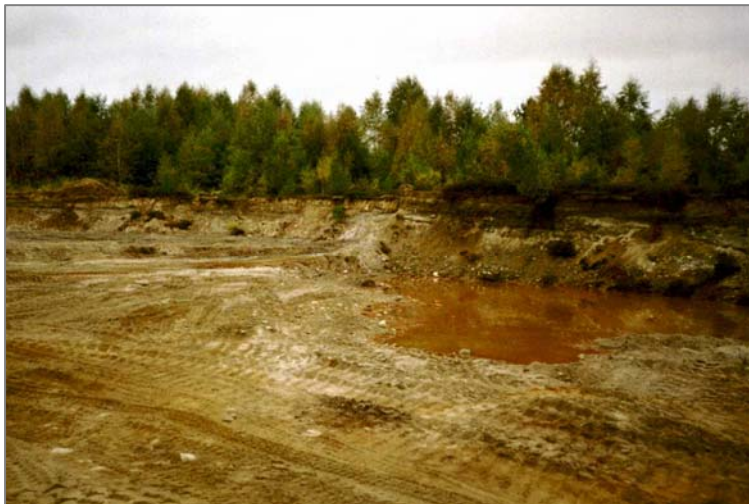
Bilde 4, venstre: Grustak syd for deponi med dam som aldri tørker. Dammen ble prøvetatt og analysert.

Sannsynligvis representerer ikke fyllingen noe betydelig miljøproblem, til tross for funn av fremmedstoffer på lavt nivå i tilstøtende dammer/grunnvann. Så lenge lokal bekk og evt også grunnvann blir benyttet som drikkevannskilde vil vi anbefale at det gjøres videre undersøkelser av tilstand, muligvis etterfulgt av tiltak ved fyllplassen. Grunnvannet rundt fyllingen bør undersøkes ytterligere mhp sammensetning og strømningsforhold, og deretter kan det bli aktuelt å drenere fyllplassen. Det er mulig at supplerende tiltak også kan bli påkrevd. I hht klassifiseringene i kap. 2.1 plasseres fyllingen i kategori 3 pga. sannsynlig spredning til drikkevannskilde. Alternativt bør drikkevannsuttaget stenges.