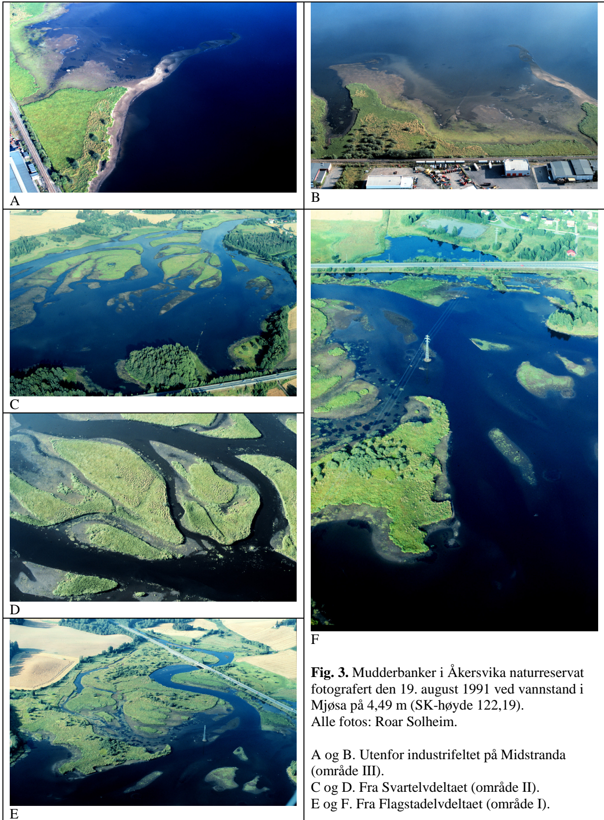
Fig. 3. Mudderbanker i Åkersvika naturreservat fotografert den 19. august 1991 ved vannstand i Mjøsa på 4,49 m (SK-høyde 122,19).

A og B. Utenfor industrifeltet på Midstranda (område III).