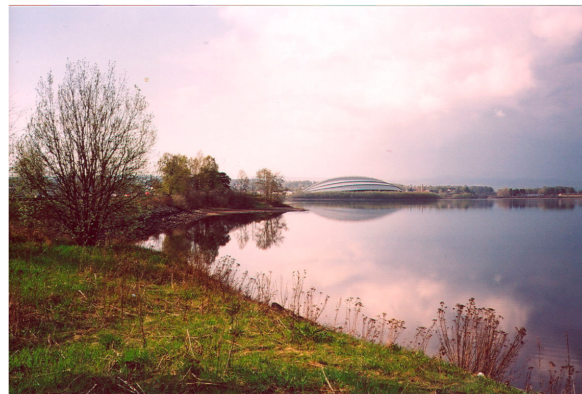
Åkersvika og Riksveg 222-fyllingen sett fra Stangesida mot Vikingskipet. Bildet er tatt den 5.5.2004 ved lokal vannstand 3,9 m, dvs. 121,6 m.o.h.