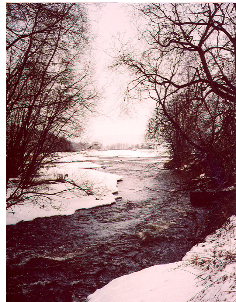
Viggas utløp i Røykenvika den 23. mars 2004