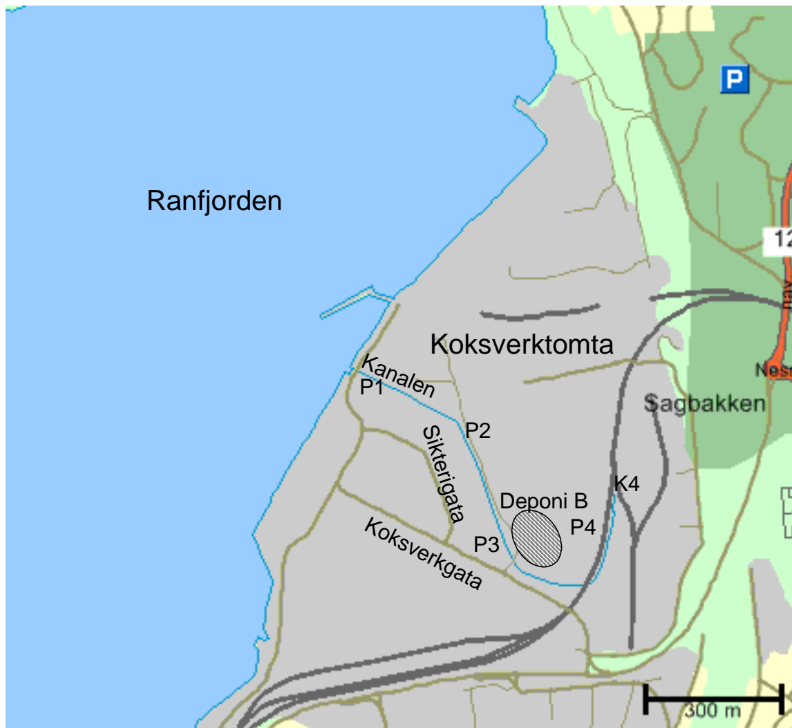
Figur 1. Kanalen og målepunktene P1-P4 (kopi fra Hunnes, 2002).