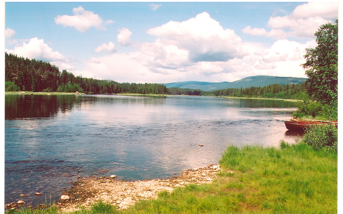
Renaelva, et sentralt vassdrag med tilknytning til Regionfelt Østlandet. Bildet er tatt ved Flåtestøa, like før samløp med Søre Osa og ca. 4 km nedstrøms planlagt oversettingsområde (OVAS) for Ingeniørvåpenet.