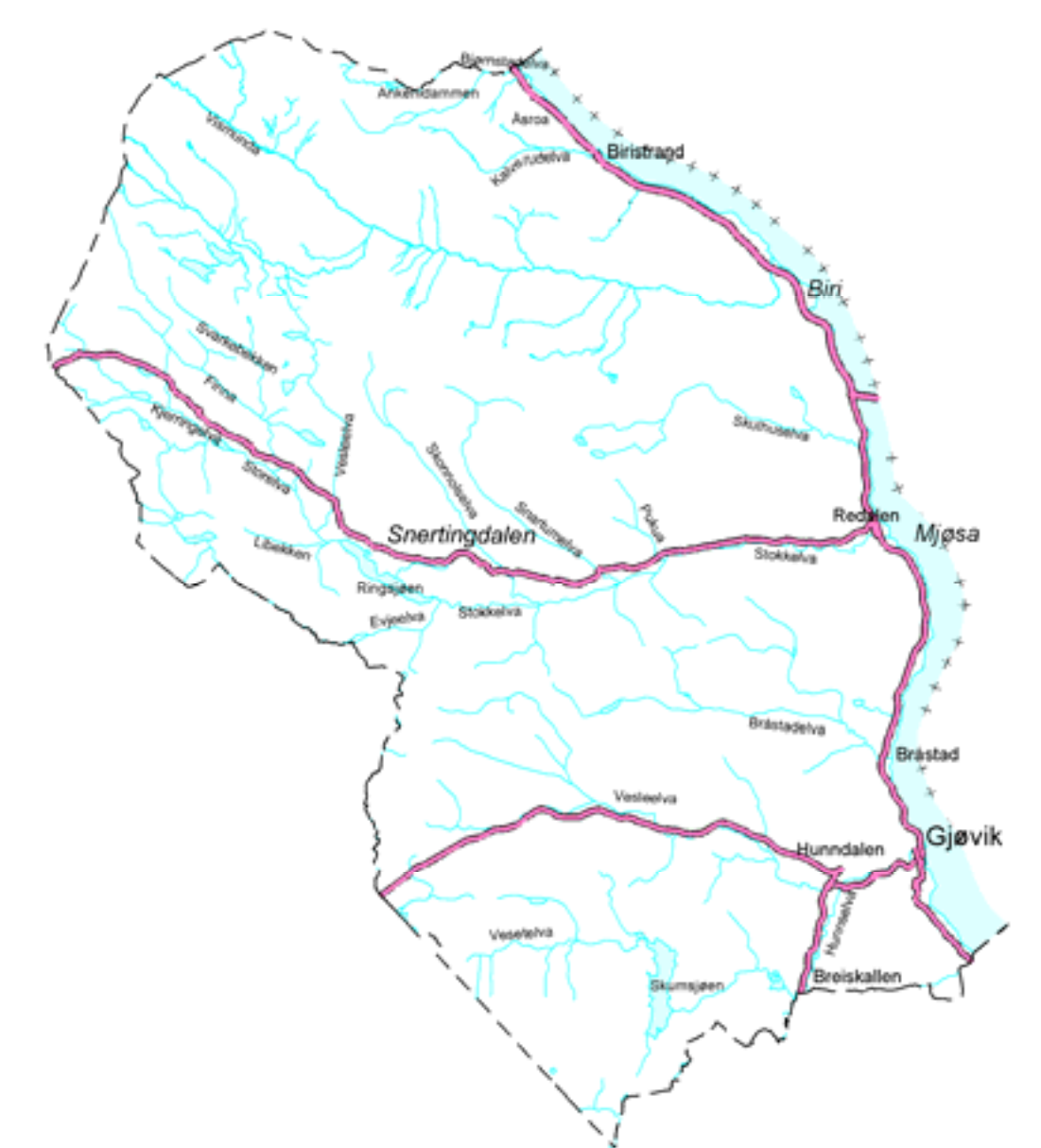
Figur 2. Vassdrag i Gjøvik kommune som inngår i det kommunale overvåkingsprosjektet.