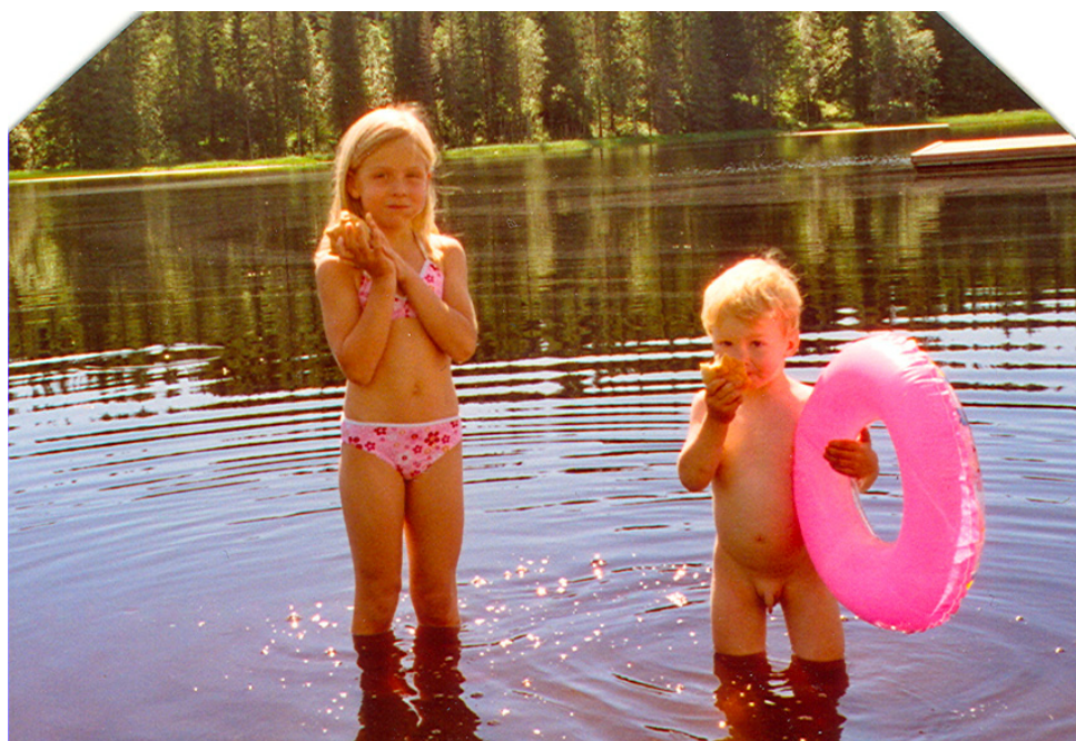
Badeliv i Glæstadjernet