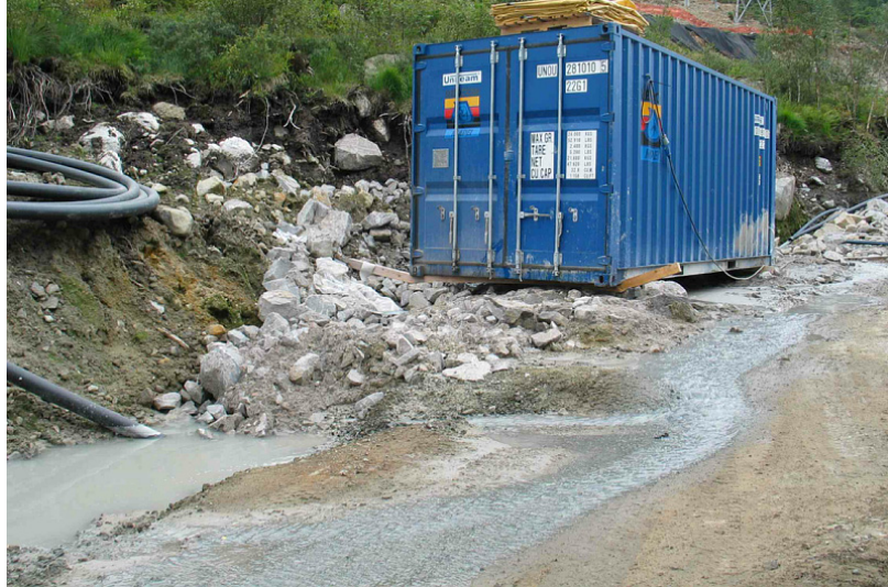
Bilde av container som inneholdt 8 MAPEQUICK tanker. Utslippet var på utsiden av denne.