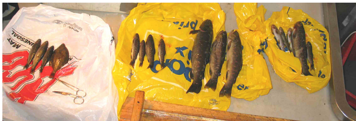
Figur 2. Bilde av fisken før utklipping av gjelleprøver. Rekkefølgen fra venstre til høyre sammenfaller med rekkefølgen i tabell 3.