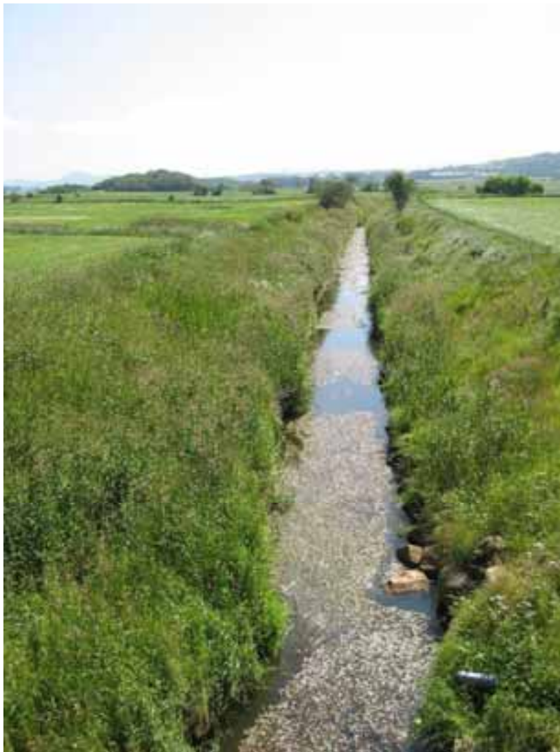
Skas Heigre