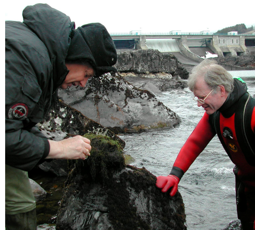
Biologiske feltobservasjoner ved Hunderfossen i april 2006. Studie av innsamlet vannmose.

Biologiske feltobservasjoner i Gudbrandsdalslågen nedstrøms Hunderfossen vinteren 2005 og våren 2006.