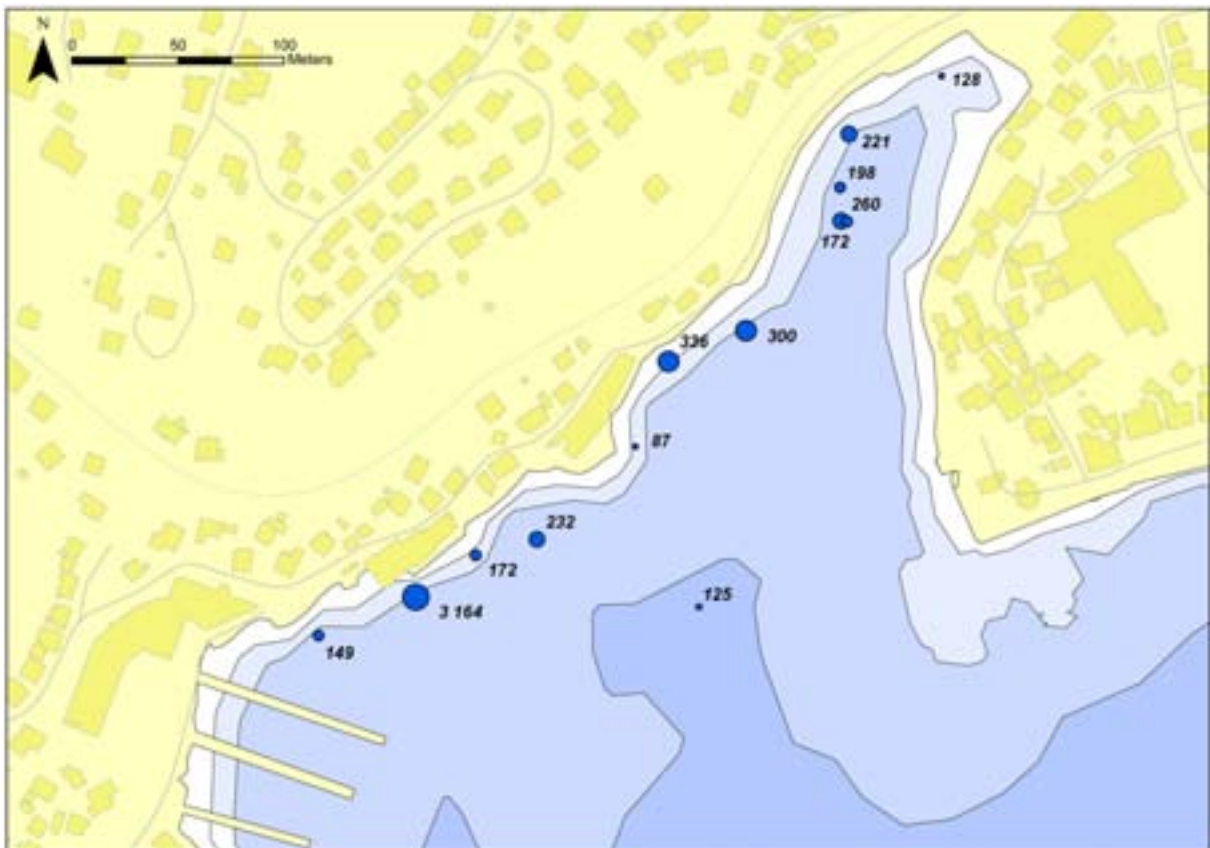
Figur 5. Human helserisiko for de enkelte stasjoner i henhold til Trinn 2. Tallet angir antall ganger konsentrasjonene overskrider grenseverdien for human helse summert over alle de analyserte stoffene. Størrelsen på punktet illustrerer størrelsen på risikobidraget fra denne stasjonen.