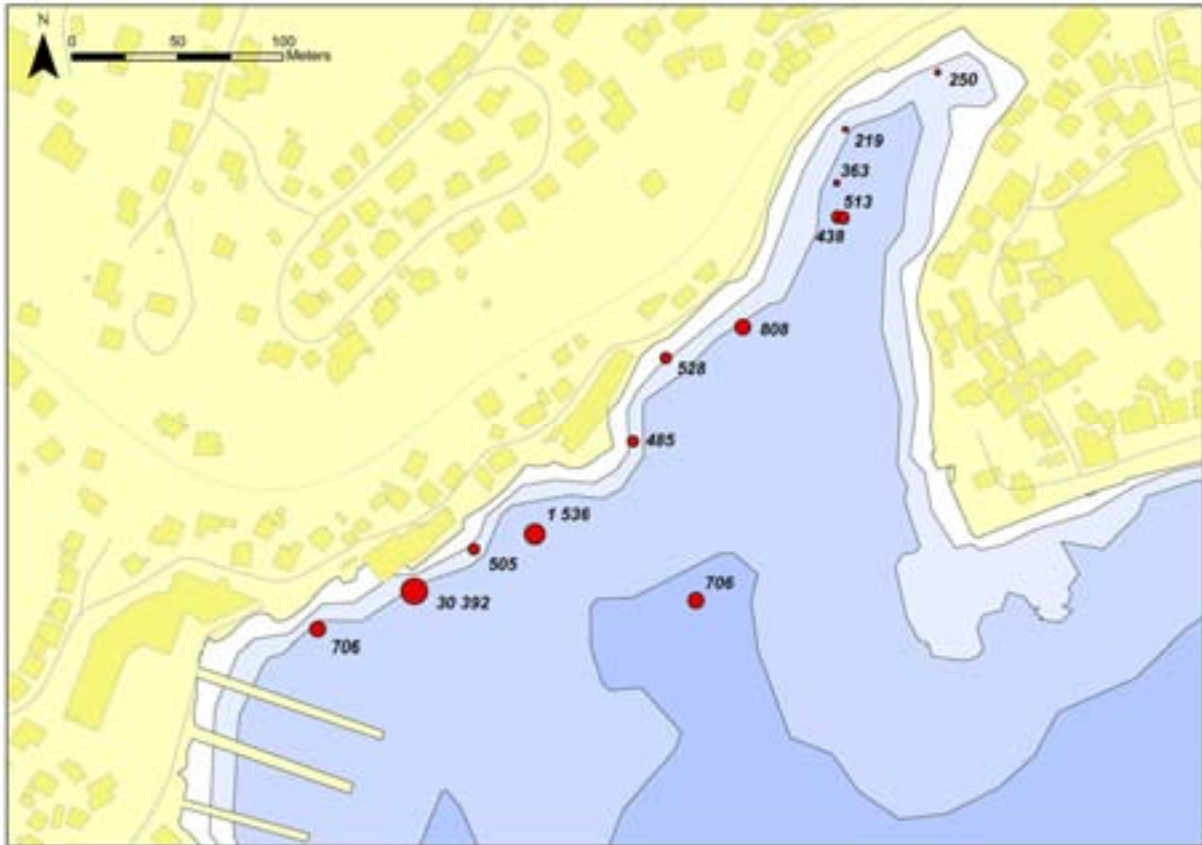
Figur 4. Beregnet total risikoindeks for hver av stasjonene i denne undersøkelsen. Størrelsen på punktet er proporsjonal med indeksverdien og tallet angir antall ganger konsentrasjonen overskrider grenseverdien summert over alle de analyserte stoffene.