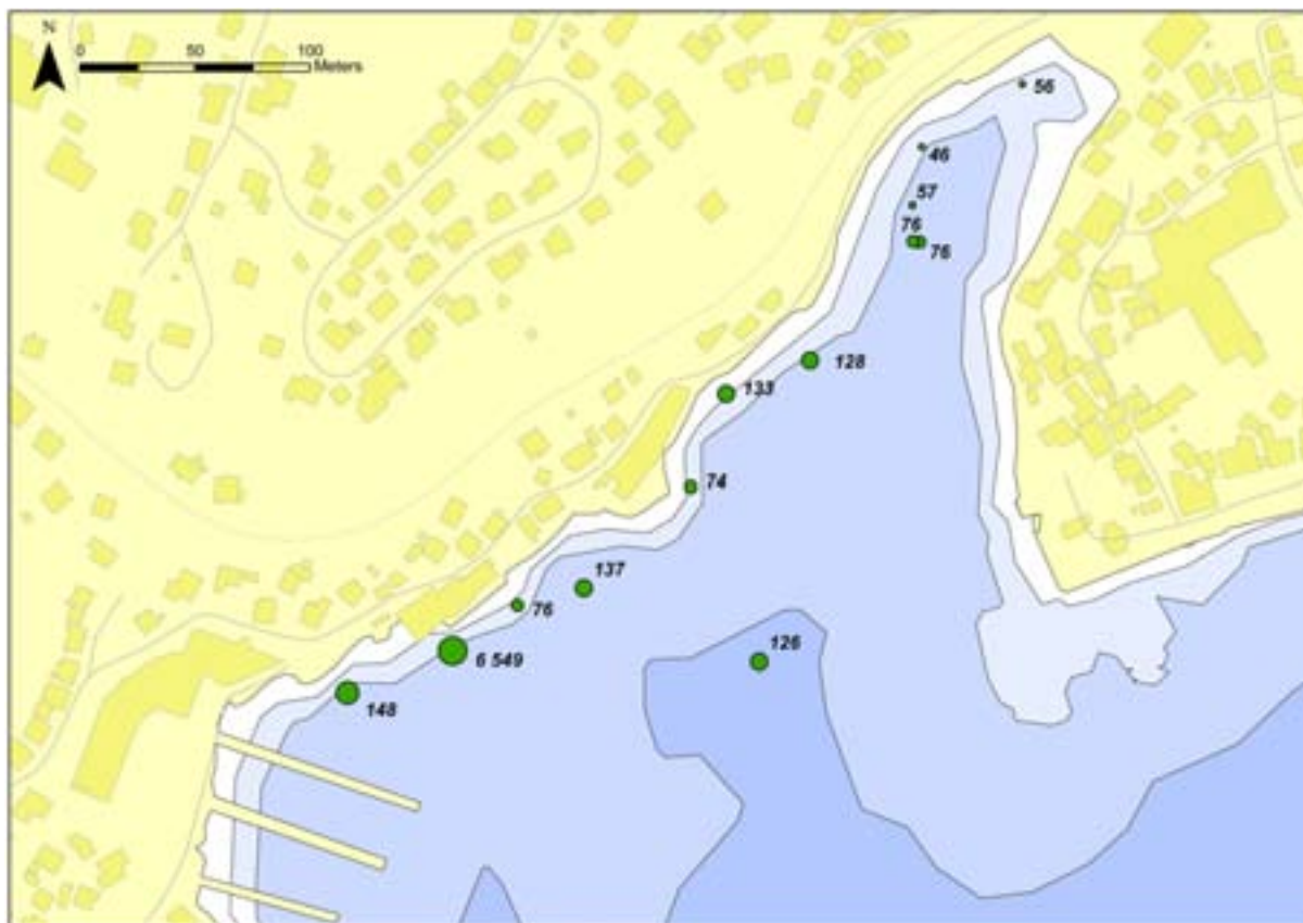
Figur 6. Økologisk risiko for de enkelte stasjoner i henhold til Trinn 2. Tallet angir antall ganger konsentrasjonene overskrider grenseverdien for skade på økosystemet summert over alle de analyserte stoffene. Størrelsen på punktet illustrerer størrelsen på risikobidraget fra denne stasjonen.