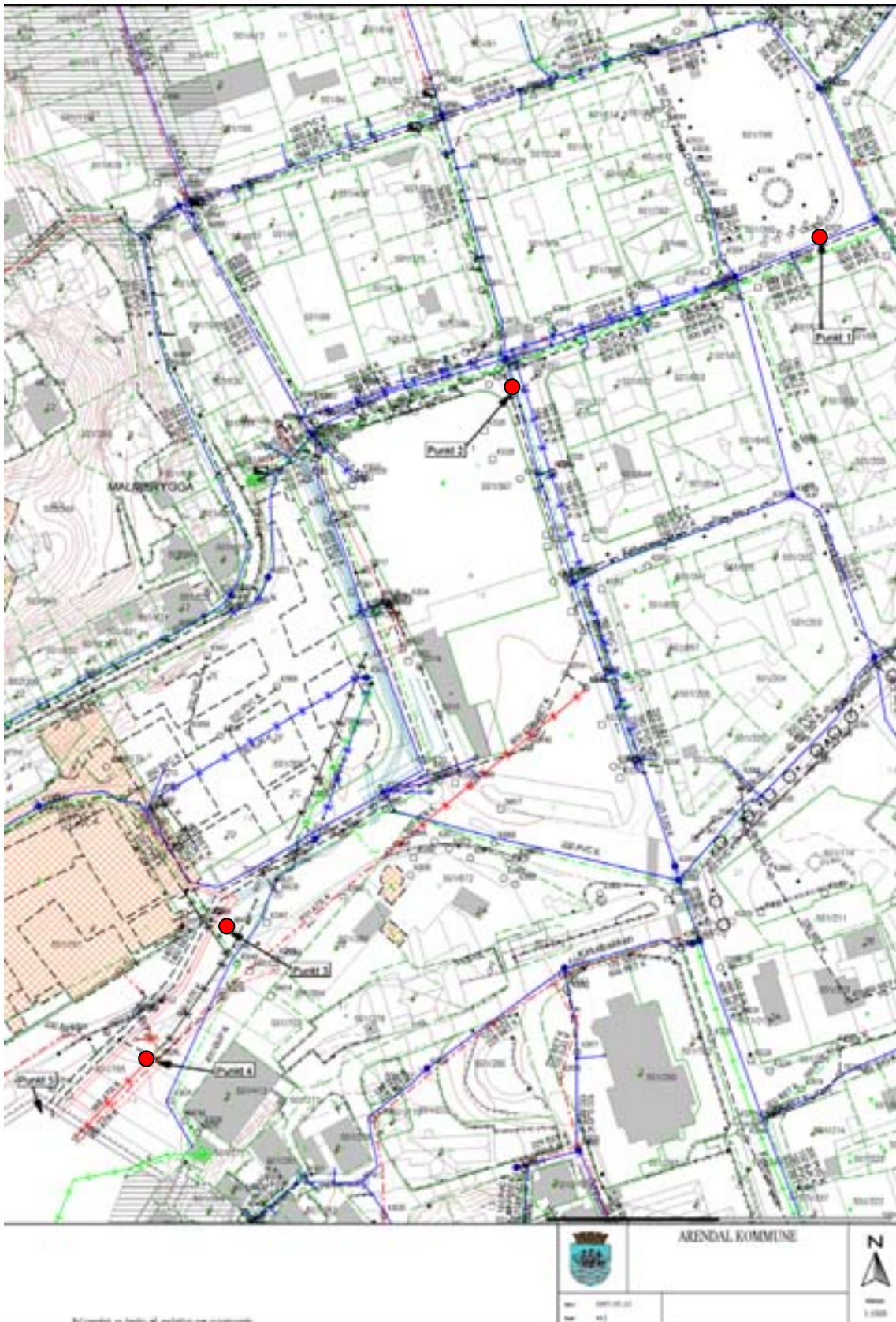
Figur 3. Posisjoner for prøvetaking av sedimenter i sandfangkummer (røde fylte sirkler) i Arendal sentrum 16. mai 2007