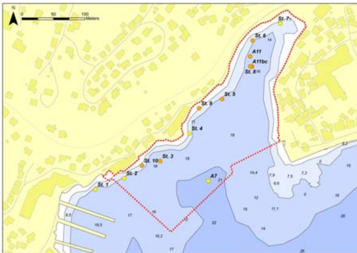
Figur 2. Posisjoner for sedimentstasjonene. Stasjoner merket A er i fra Nilsson og Næs (2005). Fargekoden på stasjonssymbolene viser SFTs tilstandsklasse med hensyn på PCB 7 . Rødt stiptet område angir sjøområdet brukt som grunnlag i risikovurderingen.