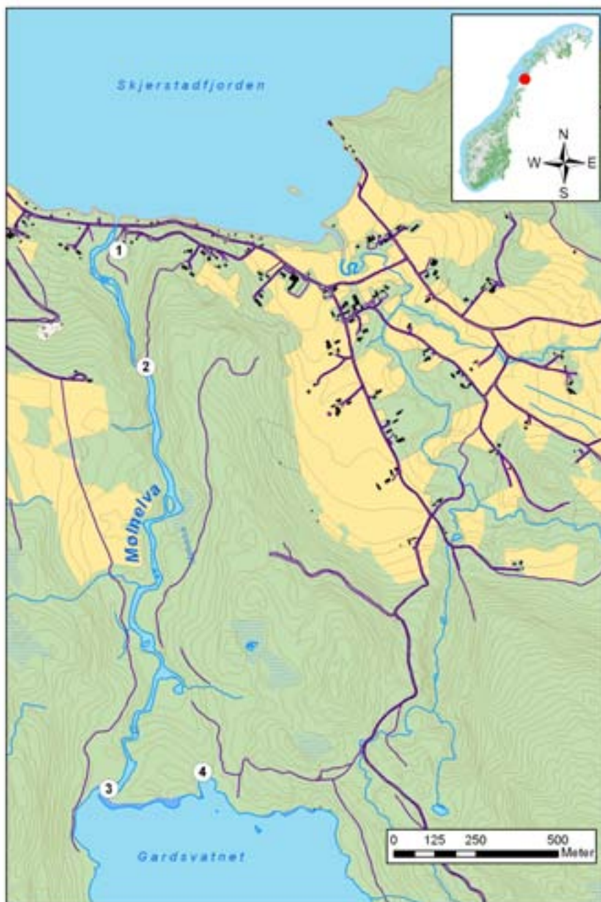
Figur 1. Kartet viser Mølnelva med settefiskanlegget (1), dagens vanninntak (2), dagens demning (3) og planlagt nytt vanninntak (4).