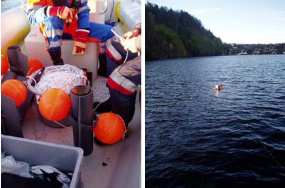
Figur 2. Bilder av sedimentfeller.