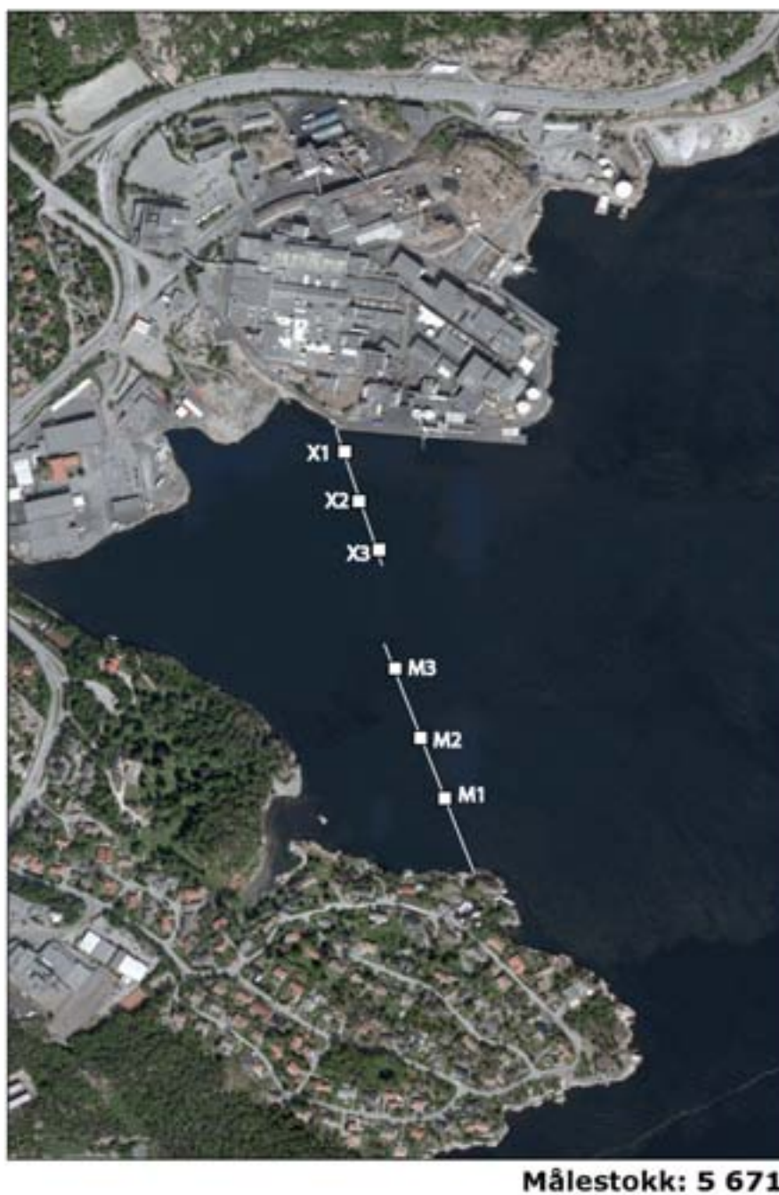
Figur 1. Plassering av sedimentfeller i Hanneviksbukta.

Sedimentfeller (indre diameter 10 cm, høyde 50 cm) ble utplassert i Hanneviksbukta 22. mai 2009 i to lenker med tre feller i hver ( Figur 1, Tabell 1 ). Fellene ble konservert med kloroform og sto ute til 21. oktober 2009.