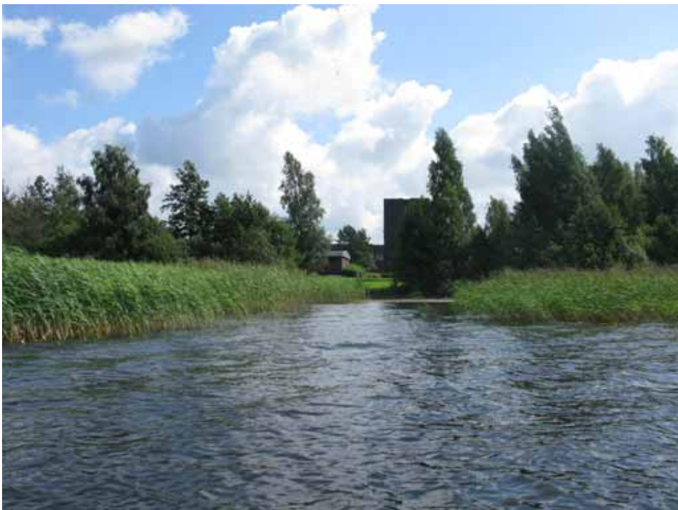
Figur 4. Stasjon 1 – Vannverksstranda ved Kjellerød der vannledningen er tenkt ført ut i Vansjø. Vannverket ses i bakgrunnen.

I det åpne partiet, der vannledningen er tenkt i landført, ble det ikke funnet noen annen vegetasjon enn et og annet takrørskudd. I landføringen her vil ikke medføre skader på vegetasjonen.