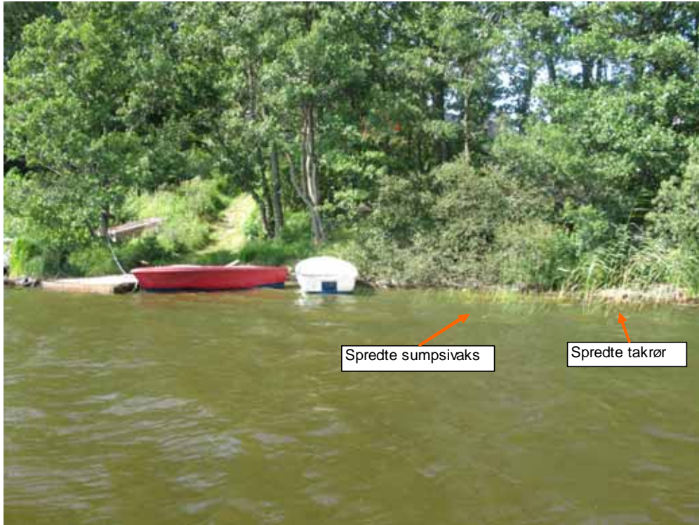
Figur 6. Vannledningens ilandføringspunkt på Frydenlundstranda. Svært lite vegetasjon. Kun spredte forekomster av sumpsivaks og takrør helt inne ved land.