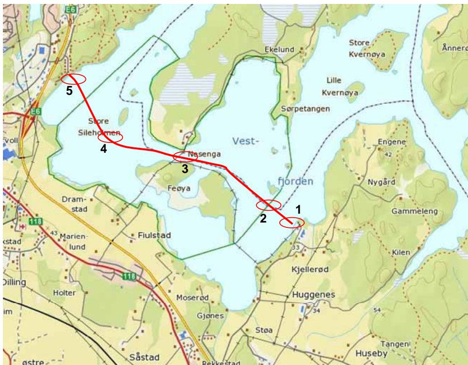
Kartgrunnlag: Statens kartverk

Undersølelsen har omfattet kartlegging av vegetasjon ved ilandføringspunktene i hver ende, og i sundet mellom Feøya og Dillingøya, samt et par andre steder langs traseen. Vannvegetasjon (undervanns- og flytebladsplanter) og de viktigste helofyttene er registrert. Det er benyttet visuell befaring for helofyttvegetasjon, vannkikkert og kasterive for vannvegetasjon. Det er også tatt prøver av bunnslammet langs traseen. Disse prøvene er analysert på næringssalter og utvalgte miljøgifter for å vurdere og spylingen og gravingen vil kunne virvle opp slike stoffer som kan ha uheldig effekt på miljøet. Tilgrusning og tilslamming i seg selv vil også gis en enkel vurdering. Feltarbeidet er utført i august, da vannvegetasjonen må være velutviklet før den lar seg kartlegge. Likeledes er det en fordel for naturresevatet at fuglenes hekkesesong er over.