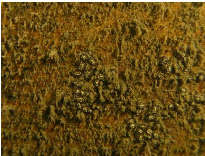
Bilde 6. Revmoring med begynninge begroing av det skorpeformete (kolonidannende) sekkdyret Botryllus , samt belegg med klebrig sediment, sannsynligvis innblandet mikroalger/mikroorganismer.