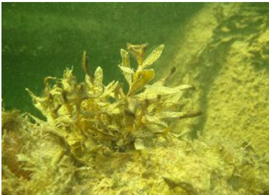
Bilde 10. Japansk drivtang på skipvollstøtten.