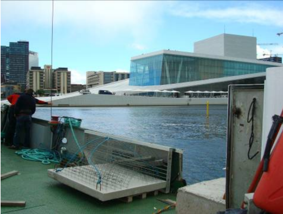
Bilde 3. Renserev på dekket av dykkebåten.