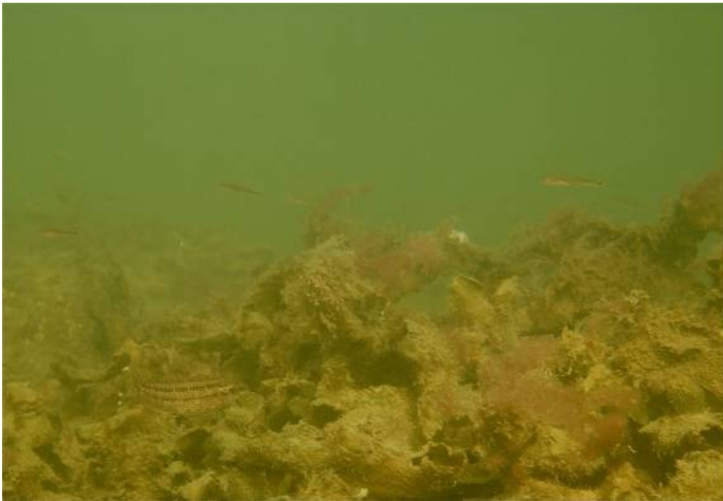
Bilde 9. Sagtang transplantert til skipsvollstøtten. Tangen er noe tildekket av slam, og noe begrodd med rødalger. Vi ser også en sjøstjerne, en grønngylt og noen få tangkutling.

Et typisk tegn ved eutrofiering (høye tilførsler av næringsalter), er at langtlivende alger som tang blir overgrodd av kortlevde, trådførmete alger. Dette kan være et kortvarig fenomen, men i noen tilfeller vil det bety at tangen blir fullstendig dekket og kvalt. De kortlevende algene er et sesongfenomen, og med de moderate mengdene vi observerte på skipsvollstøtten er det sannsynlig av tangen vil klare seg og vokse videre og muligens spre seg, noe som vil vise seg utover våren. Dette er i så fall i tråd med en tendens med mer vekst av tang som overtar der trådalger dominerte tidligere, som er registrert fra flere steder i Indre Oslofjord som en følge av de opprensingstiltak som er foretatt de seneste årene. Forekomst av kutlinger og leppefisk tyder på at det er næringsdyr i området, og framvekst av mark, bløtdyr og små krepsdyr som er transplantert eller spredd seg inn kan undersøkes nærmere ved nye innsamlinger.