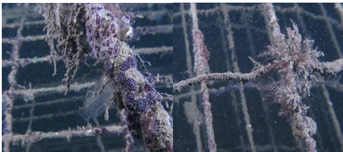
Bilde 7 og 8. Begroing på bøylene på renserevene. Vi ser hydroider, enkeltstående og kolonidannende sekkdyr og rødalger.