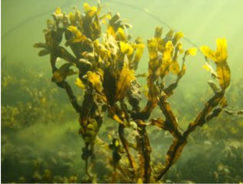
Bilde 12. Blæretang fra trappene nedenfor operaen.