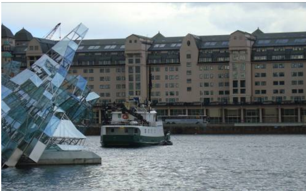
Bilde 1. Dykkebåten i posisjon til å sette ut revene.