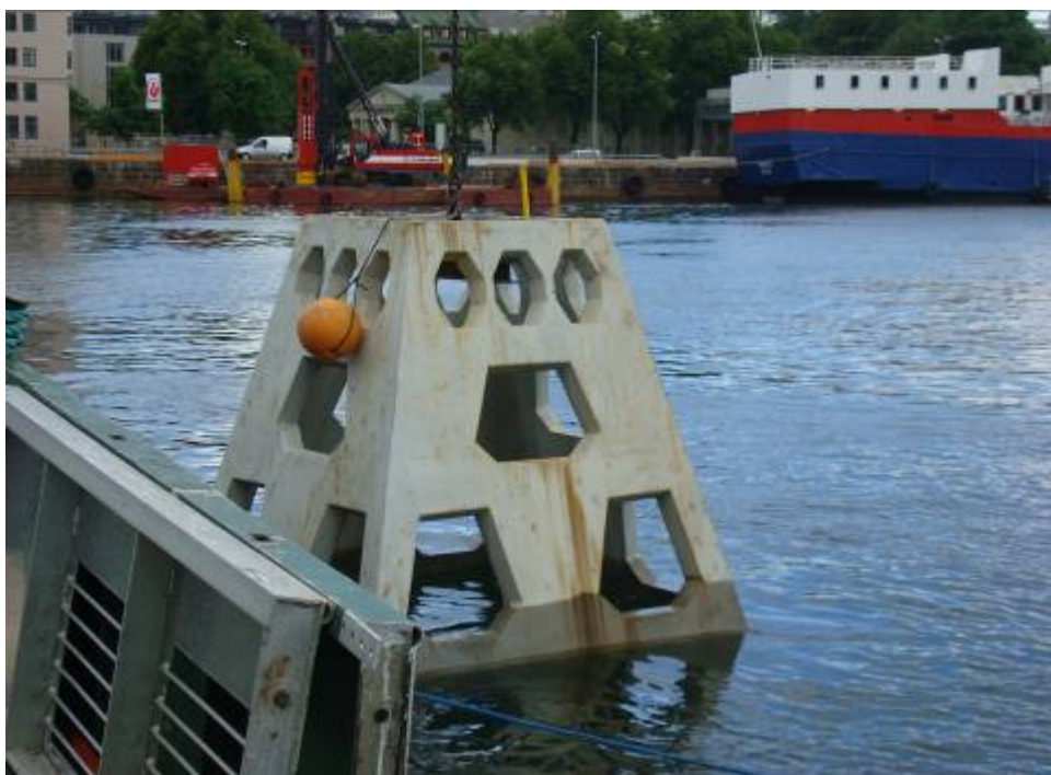
Bilde 2. Pyramideformet rev, fiskerev, på vei ut i sjøen.