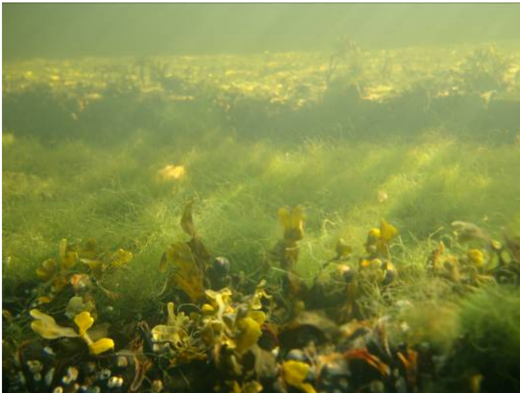
Bilde 13. Blæretang, krøllhårsalge og blåskjell (i forgrunnen) fra trappene nedenfor operaen. Rur og strandsnegl forekommer også på bildet.