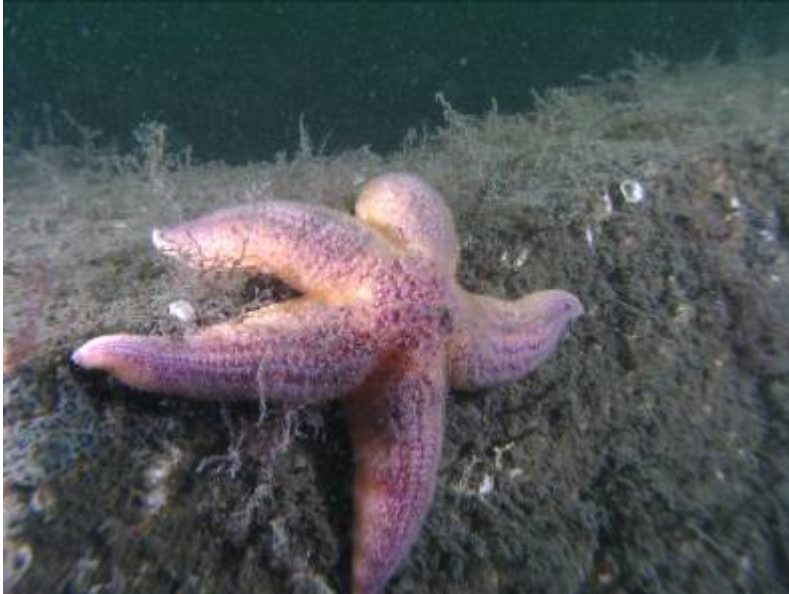
Bilde 4. Toppen av et fiskerev begrodd med hydroider og kalkrørsmark, og en sjøstjerne.