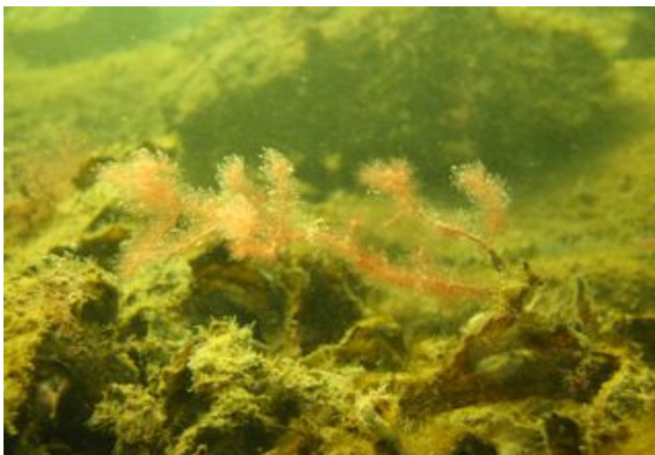
Bilde 11. Rødalgen strömgarn fra skipvollstøtten.