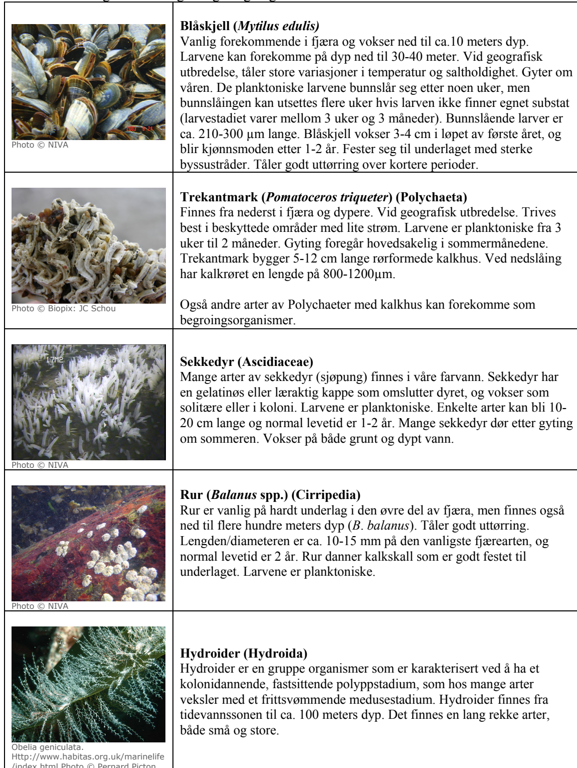
Tabell 2. Biologien til utvalgte begroingsorganismer