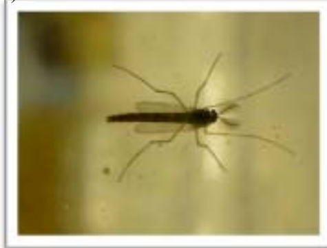
Figur 3. A) Oppsett av 28-dagers toksisitetstest med fjærmygg. B) Larvenes graveaktivitet i sedimentet etterlater små tunneller. C) Klekket fjærmygg-hann