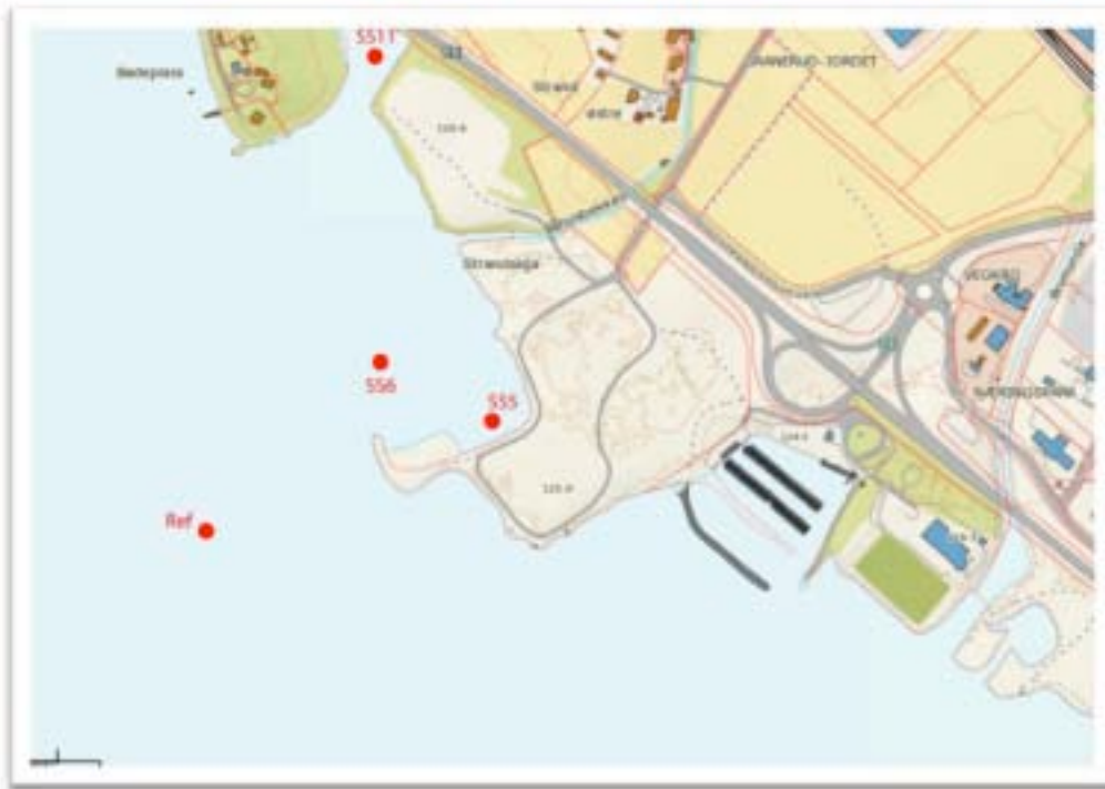
Figur 1. Fire stasjoner for sedimentprøvetaking til toksisitetstest ble valgt på grunnlag av tidligere undersøkelser. Stasjonene ble valgt med utgangspunkt i et punkt med antatt lav forurensning (Ref), DDT forurensning (SS5), oljeforurensning (SS6) og PCB forurensning (SS11).