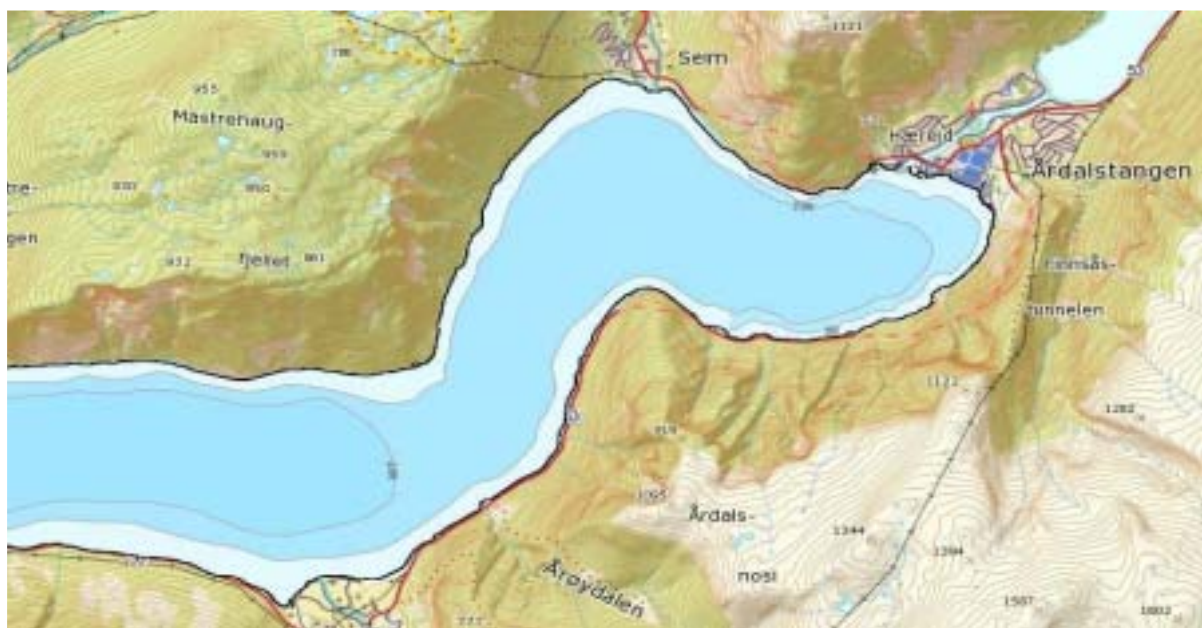
Figur 1. Oljeutslippet skjedde hos Hydro Aluminium Årdal på Årdalstangen innerst i Årdalsfjorden.

Det er estimert at ca 6800 liter av oljen Theriminol 66 rant ut i Årdalsfjorden. Oljen hadde temperatur på ca 180 °C da den rant ut i sjøen.