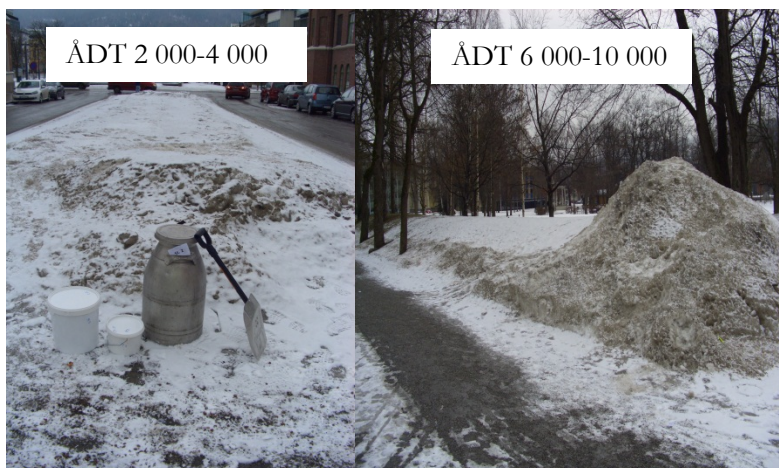
Figur 1. Snø fra Drammen sentrum 20.2.2012.