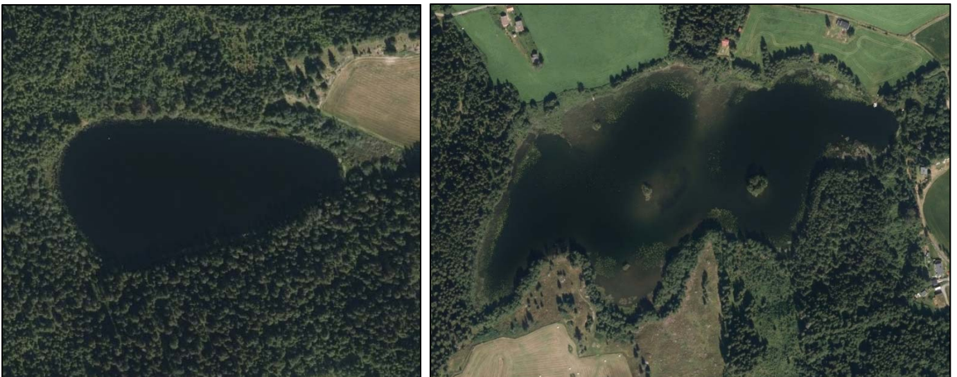
Figur 1. Kartutsnitt med de undersøkte kalksjøene Holtjern (venstre) og Kruggerudtjern (høyre) i Lunner kommune. Kart og flybilder fra norgeskart.no.