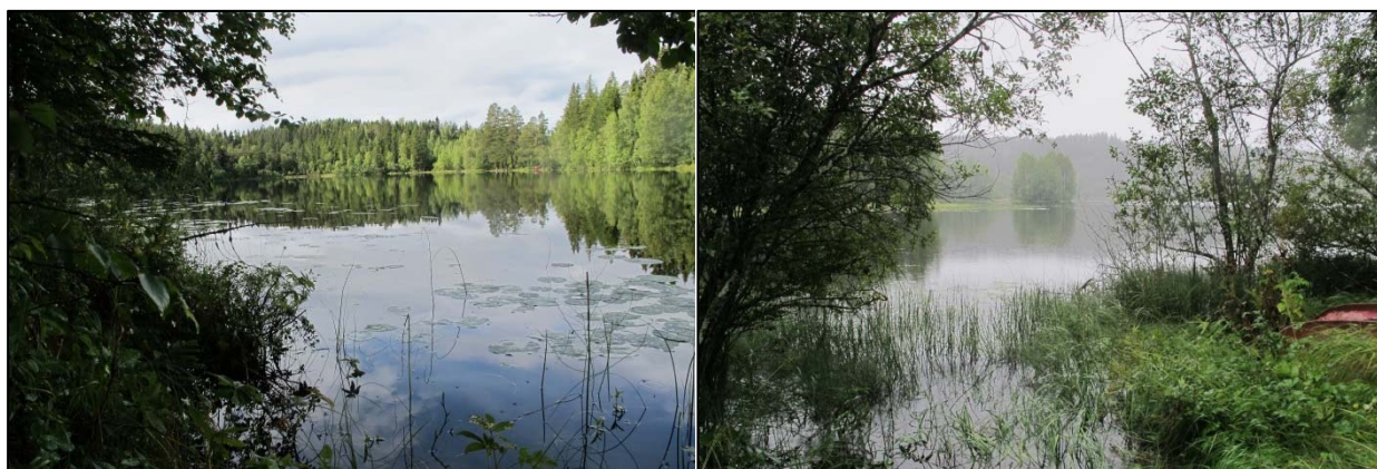
Figur 3. Oversiktsbilder av Høltjern (venstre) og Kruggerudtjern (høyre), september 2015.