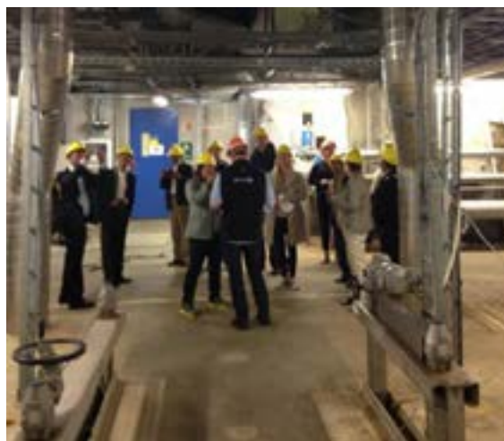
Figur 1. Omvisning på Bekkelaget Renseanlegg, IWRM-kurs i Oslo, september 2014

Del II i kurset i Vannressursforvaltning ble arrangert i Oslo 8. – 12. september 2014. Et detaljert program med beskrivelse av kurset er vist i vedlegg B sammen med en liste over deltakere. Inkludert i kurset var bl.a. en omvisning på Bekkelaget Renseanlegg i Oslo, og et bilde herfra er vist i Figur 1 .