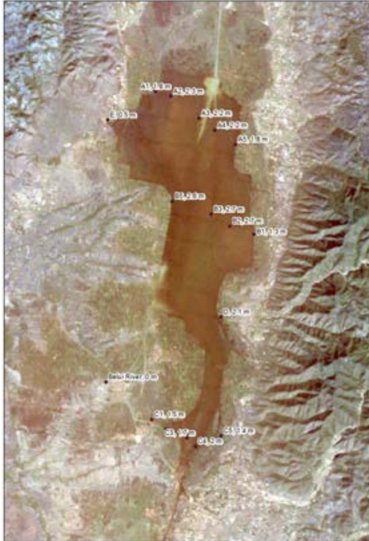
Figur 2. Prøvetaking i Inlay Lake langs tre transekter á fem punkter, november 2014. I figuren vises de reelle prøvetakingspunktene med dybdeangivelser.

De første prøvene for bestemmelse av næringssalter og metaller er samlet inn og analysert, og det er tatt prøver av planteplankton og vannplanter. Noen analyser ble gjort på stedet, mens en del av prøvematerialet ble fiksert for videre studier i laboratoriet. Prøver av vannplantene ble brakt med tilbake til NIVA for sikker taksonomisk bestemmelse, og vannprøver ble brakt til NIVAs laboratorium for kjemisk analyse. Det ble tatt prøver i tre transekter med fem punkter i hvert transekt (Figur 2).