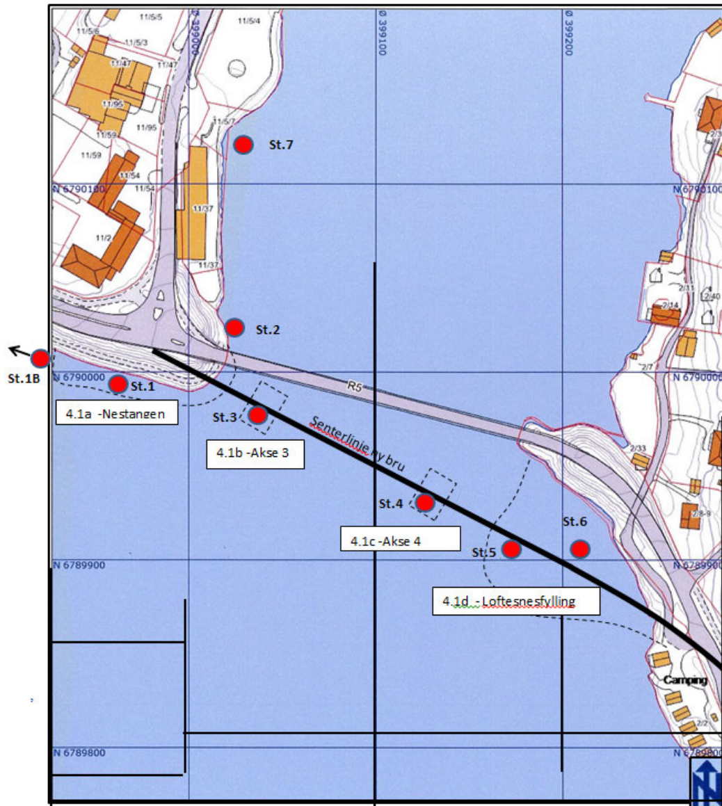
Figur 1. Stasjonskart. Stasjon 1-7 ble undersøkt i pilotundersøkelsen, mens stasjon 1B, 5, 6, og 7 ble undersøkt under hovedundersøkelsen.