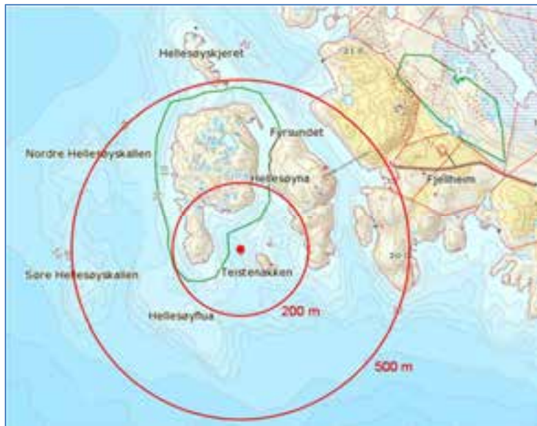
Figur 2. Utstrekning av et influensområde med radius henholdsvis 200 og 500 m rundt vraket av MS Server. Et enkelt utslipp vil bare spre seg innenfor en del av influensområdet avhengig av strøm og værforhold.

Vi har tatt utgangspunkt i to størrelser på et akseptabelt influensområde: ut til avstand 200 m og 500 m fra vraket. Et område ut til avstand 200 m vil dekke det grunne lokalområdet rundt vraket og inn til f.eks. Hellsøy fyr (Figur 2). En radius med avstand 500 m vil dekke hele sjøområdet rundt Hellsøy. I det enkelte tilfellet vil et utslipp bare spre seg i en del av influensområdet avhengig av strøm og værforhold.