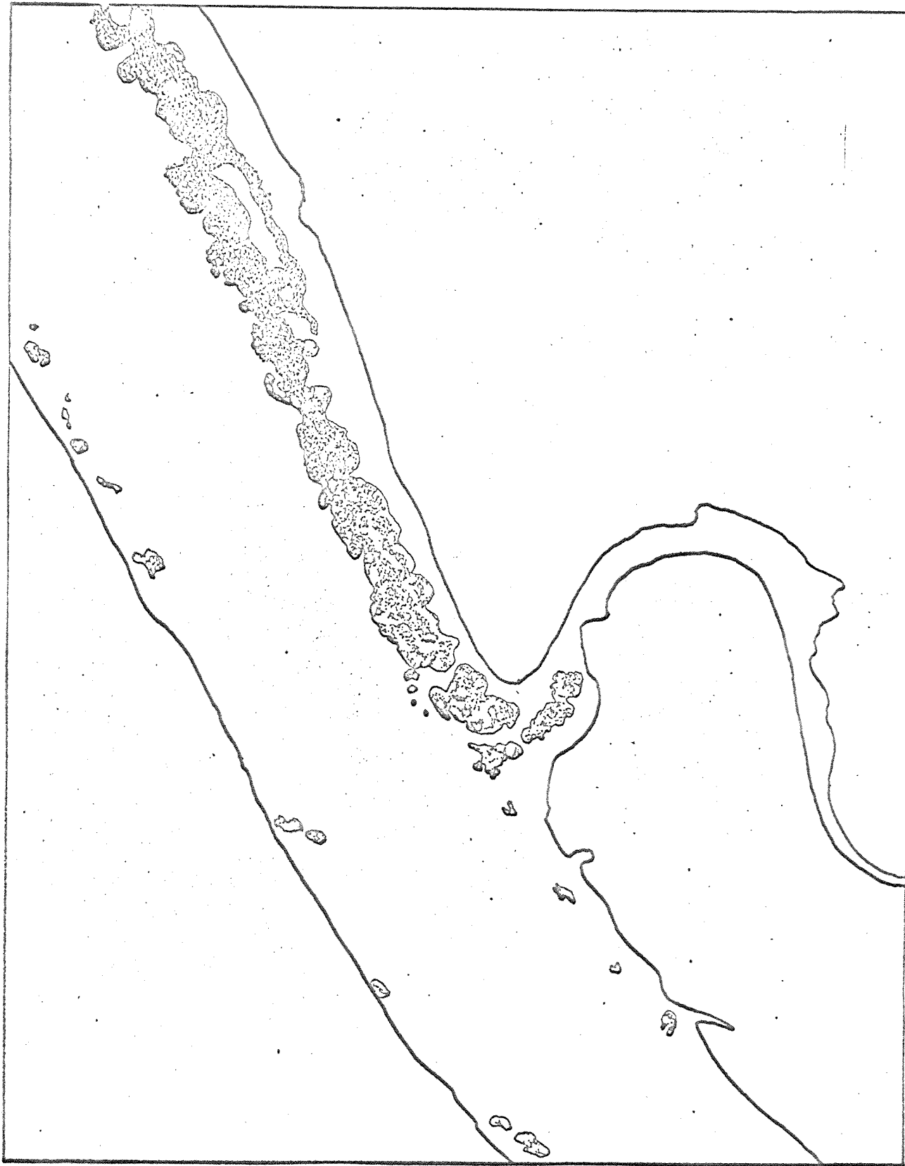
Fig. 2. Nitelva ved Valstad, like nedenfor Kjellerholen bru. Skisse over Sparganium simplex -kolonier etter originalbilde på Ektachrome Infrarød.

En bekk belastet med plantenæringsstoffer gir opphav til sterk begroing i elven. Partier av koloniene med blålig farge, dvs. minsket infrarødreleksjon, er prikket inn og gir et tydelig bilde av minsket biomasse med økende avstand fra utslippstedet. Dette er ikke mulig å observere direkte uten hjelp av infrarød fargefilm.