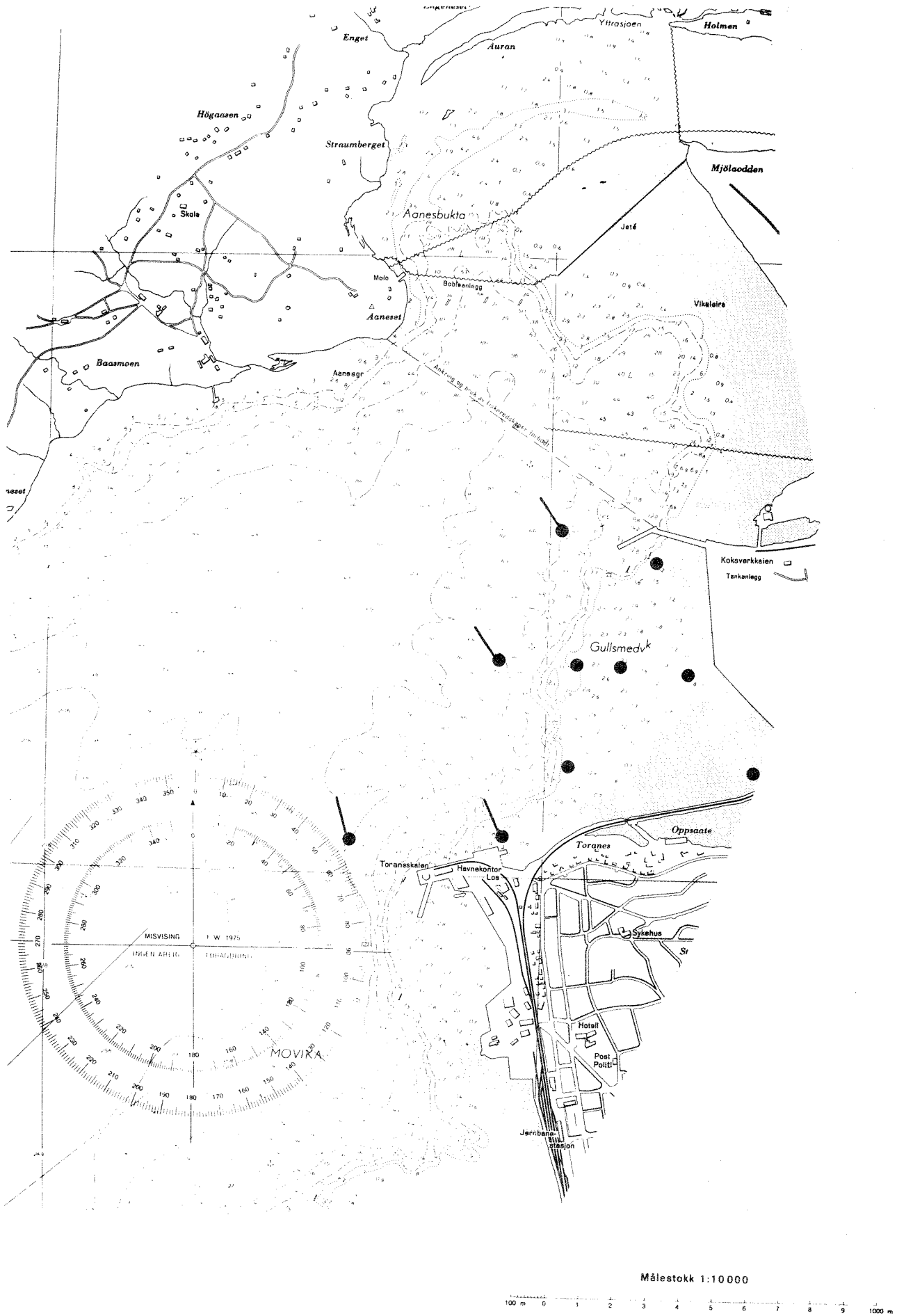
Fig. 1. Stasjonsplassering for undersøkelse av spredning/ nedbrytning av avløpskomponenter fra Koksverket. Pilotundersøkelse. Dypstasjoner er merket med /