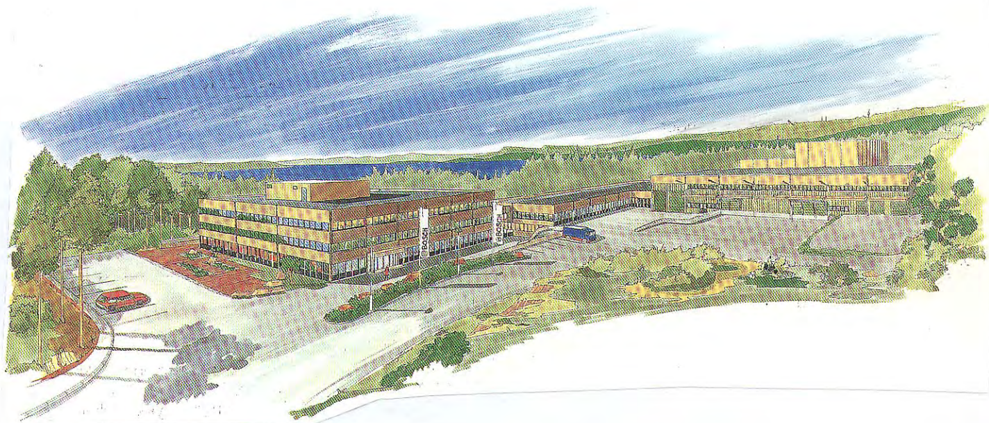
Figur 1. Oversikt over Robert Bosch A/S.