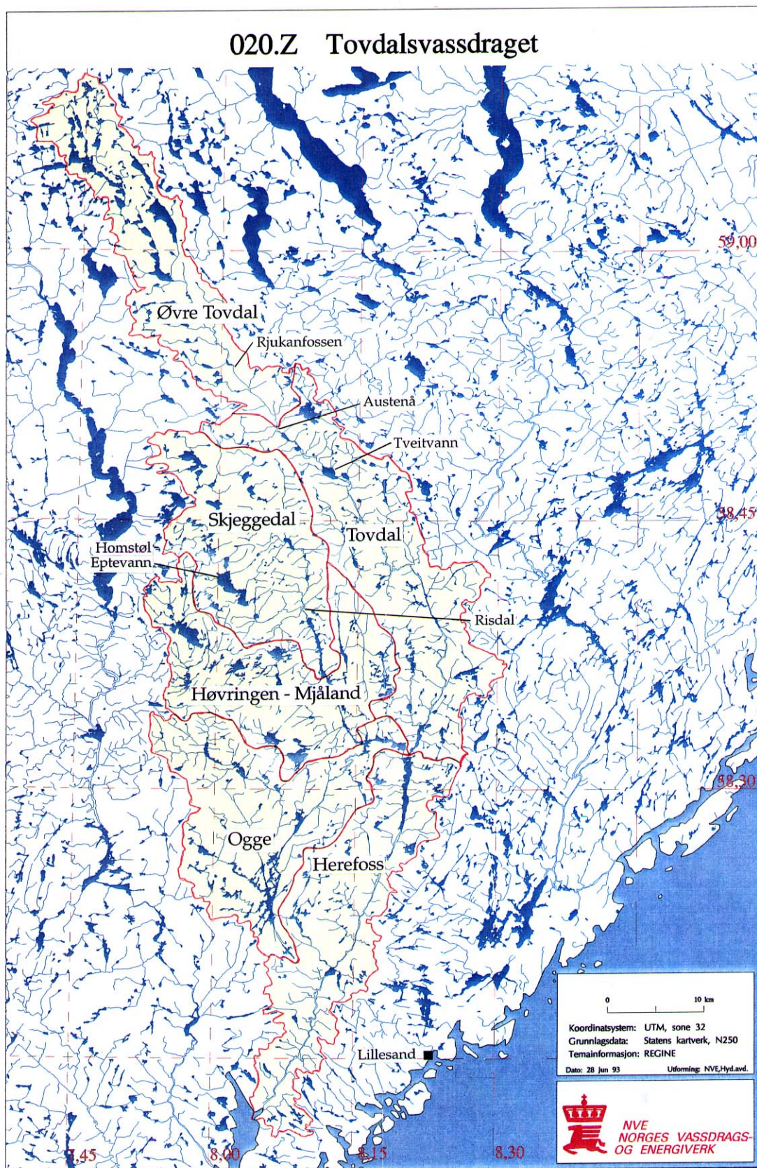
Figur 1. Tovdalsvassdraget med avgrensning av seks delfelt. Hvert delfelt er sammensatt av minsteenheter i vassdragsregisteret (REGINE). Kartgrunnlag fra NVE.