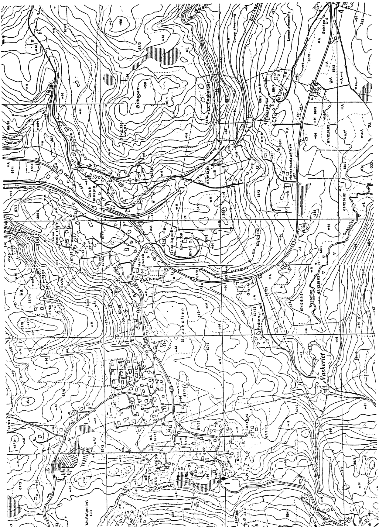
Figur 2. Kartskisse over området rundt Muttatjern og ved Sveselva ved Grua. Målestokk: 1:10 000