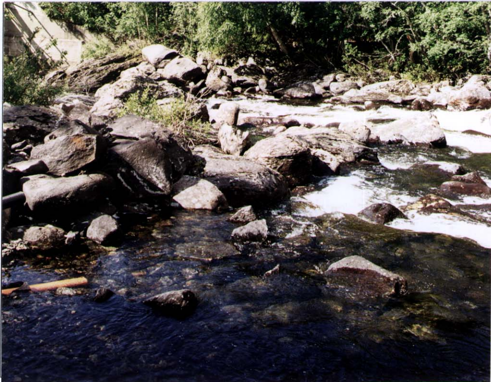
Utslippssted for prosessvann i Vindeåni, fra Vindin Vassverk.