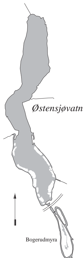
Figur 2. Kart over Østensjøvann.

Vannvegetasjonen i Østensjøvann ble undersøkt 28. september 1999. Registreringene ble gjort ved hjelp av båt, vannkikkert og kasterive og kvantifisering av vannvegetasjonen er gjort etter en semi-kvantitativ skala, hvor 1=sjelden, 2=spredd, 3=vanlig, 4=lokalt dominerende og 5=dominerende. De viktigste artene i helofyttvegetasjonen ble registrert, mens kantvegetasjon og sumpskog ikke er undersøkt. Alle dybdeangivelser er gitt i forhold til aktuell vannstand ved feltundersøkelsen. Navnsettingen følger Lid og Lid (1994).