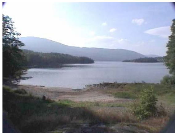
Foto 5.2 Badeplassen ved Hallen i Eikeren vil også bli berørt.

Alt. A vil berøre området Hallen ved Eidsfoss i Eikeren. Alt. A vil medføre inngrep i ei badevik i området og ellers kunne påvirke kulturlandskap/kulturstier. Alt. C antas å medføre mindre negative virkninger for selve badeområdet da dette alternativet er trukket lenger nord.