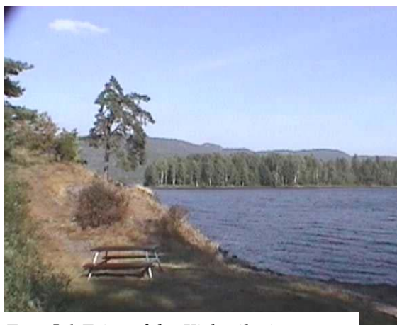
Foto 5.1 Friområdet Kirkevika i Bergsvatnet vil bli berørt av vannledningen.

I Bergsvatnet vil alt. C kunne medføre inngrep i friområdet Kirkevika ved Eidsfoss kirke. Inngrepet vil kunne medføre sår i strandsonen som vil kunne gjøre området mindre attraktivt for friluftsliv og bading. Alt. A antas å ha noe mindre negativ virkning for selve badeplassen, da dette alternativet krysser strandlinjen lenger øst.