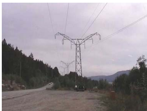
Foto 4.2 Tekniske inngrep i området: Riksveg 35 og kraftlinje på østsiden av Eikeren.

Strandområdene er flere steder påvirket av støy fra vegtrafikken. Strandsonen er stedvis endret på grunn av vegfyllinger. Det ligger også en god del hytter lokalisert i selve strandsonen, spesielt langs østsiden av Eikeren.