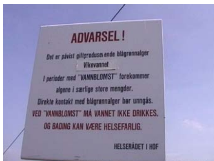
Foto 4.4 Advarsel mot bading i Vikevatnet på grunn av risiko for giftige blågrønnalger.

Strandområdene på begge sider av Eikeren brukes en god del til badeaktiviteter i sommerhalvåret. Det er tilrettelagt for bading (stupebrett, anlagt sandstrand m.v.) på campingplassene Torrud og Eikernveien. I de øvrige vatna i hovedvassdraget; Bergsvatnet, Vikevatnet, Haugestadvatnet og Hillestadvatnet, er det tidvis problemer med oppblomstring av giftige blågrønnalger og bading tilrådes derfor ikke.