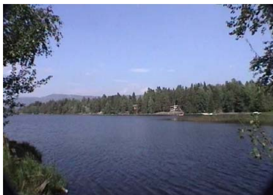
5.3 Hyttefeltet på Nes i Bergsvannet. Ledningen, alt. A, vil gå i strandsonen der bildet er tatt fra.

Under selve byggingen må det påregnes sår i landskapet som vil kunne bli synlig fra hyttene i en tid fremover inntil naturlig vegetasjon er reetablert.