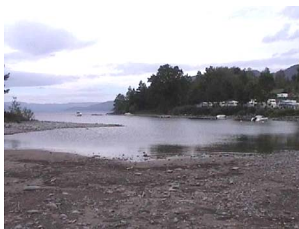
Foto 5.4 Strandsonen langs Eikeren kan bli mindre attraktiv for bading og annet friluftsliv ved økt vannuttak og lav vannstand.

Økt utnyttelse av konsesjonen vil trolig kun ha moderat effekt på vannføringen i Vestfosselva (Berge, muntlig meddel.). Det forventes derfor ikke særlig negative virkninger for hverken fritidsfiske eller kanopadling langs elvestrekningen.