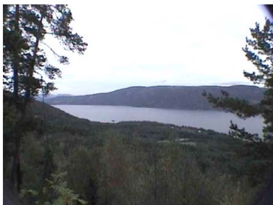
Foto 4.1 Landskapet ved Eikeren.

Fiskumvatnet (18moh) i nord er omkranset av jordbruksland, bebyggelse og veier. Det meste av jordbruksarealet er åkerareal, noe som innebærer at det visuelle inntrykket forringes noe i barmarksperioder utenom vekstsesongen. Fra Fiskumvatnet renner Vestfosselva norover gjennom et åpent jordbrukslandskap mot Hokksund hvor den munner ut i Drammenselva. Langs elveløpet er det et smalt belte med kantvegetasjon som er relativt intakt.