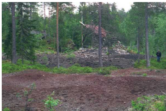
Figur 2. Rokne smeltehytte