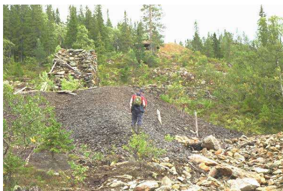
Figur 3. Malså kobberverk. Smeltehytteområdet ved Gruvebekken