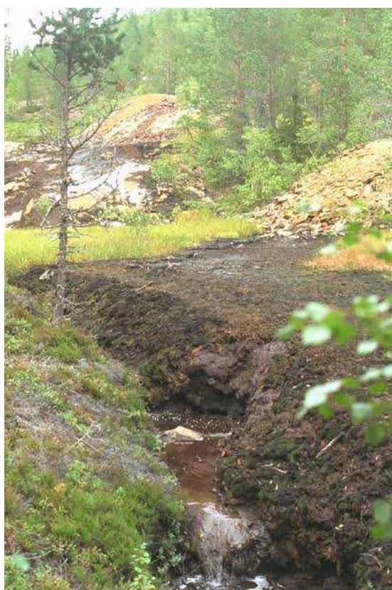
Figur 4. Samlet sigevann fra Åkervoll gruve