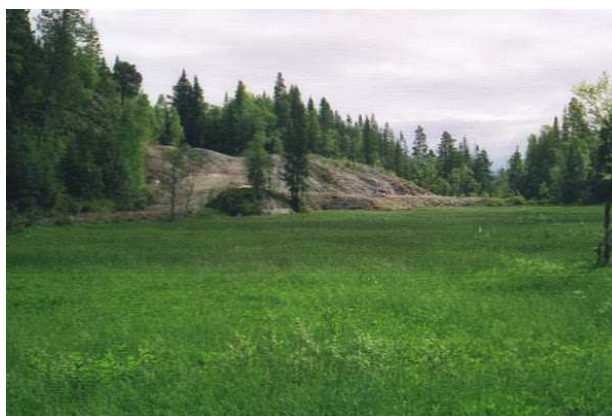
Figur 5. Skrattås sinkgruve (Fundgruben)