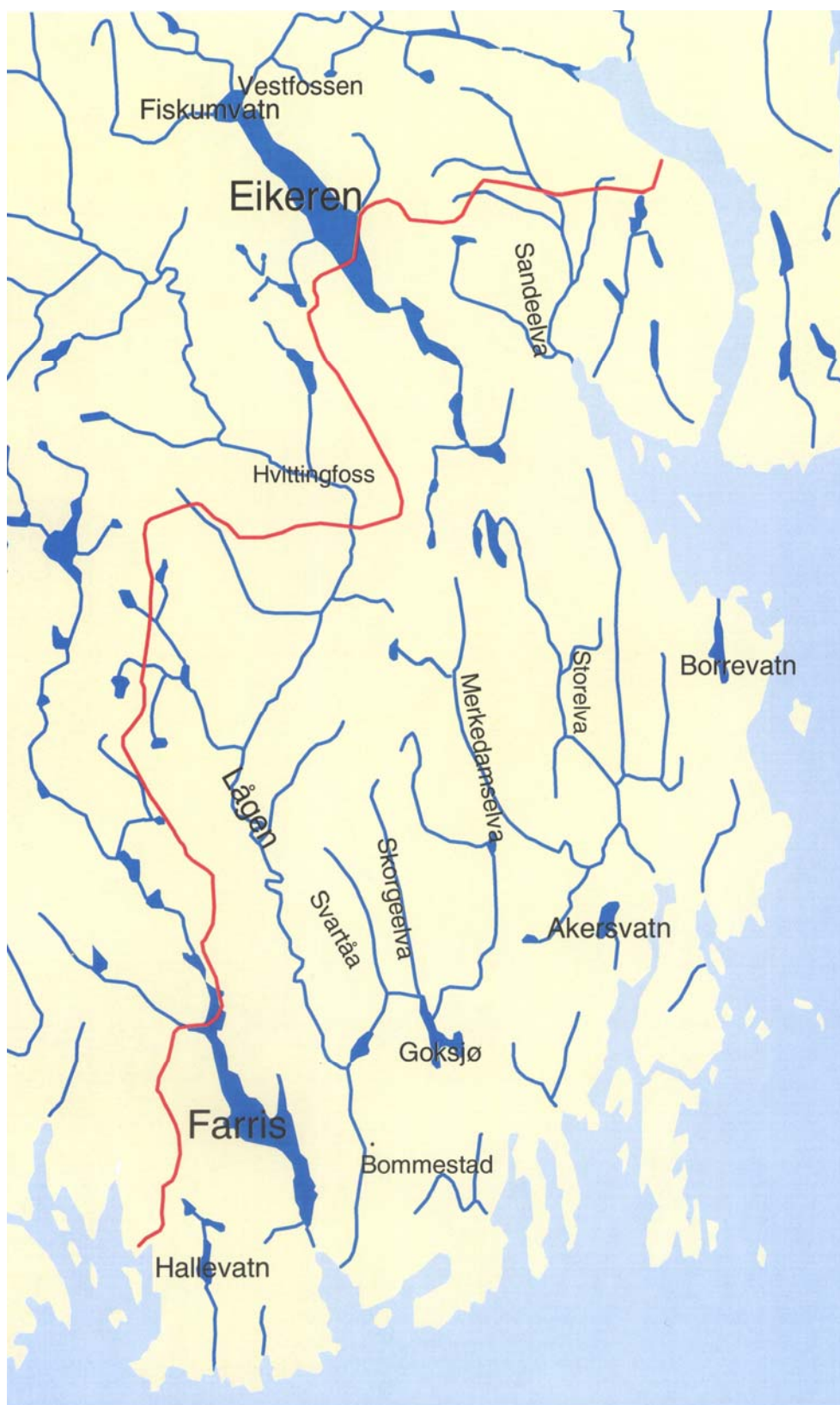
Fig. 1. Vestfold fylke med vassdrag som omtales i rapporten.