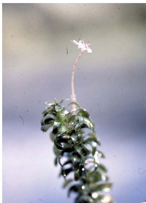
Figur 2. Vasspest ( Elodea canadensis ).

Vasspesten spres oftest ufrivillig med mennesker, f.eks. ved flytting av båter og fiskeredskap (Brandrud og Mjelde 1999), eventuelt ved utsetting av fisk og kreps (som nevnt av Kleiven og Dolmen 1999). Det siste er imidlertid lite trolig for Molandsvatn hvor det ikke har vært utsetting av fisk eller kreps siden 50-tallet. Mest sannsynlige årsak til introduksjon av vasspest i Molandsvatn blir derfor ved båt eller fiskeredskap. Når det gjelder spredning av vasspest til Evjekilen i Otra ser det ut til å kunne være sammenheng med bruk av kajaker fra Hadeland (Brandrud 1998).