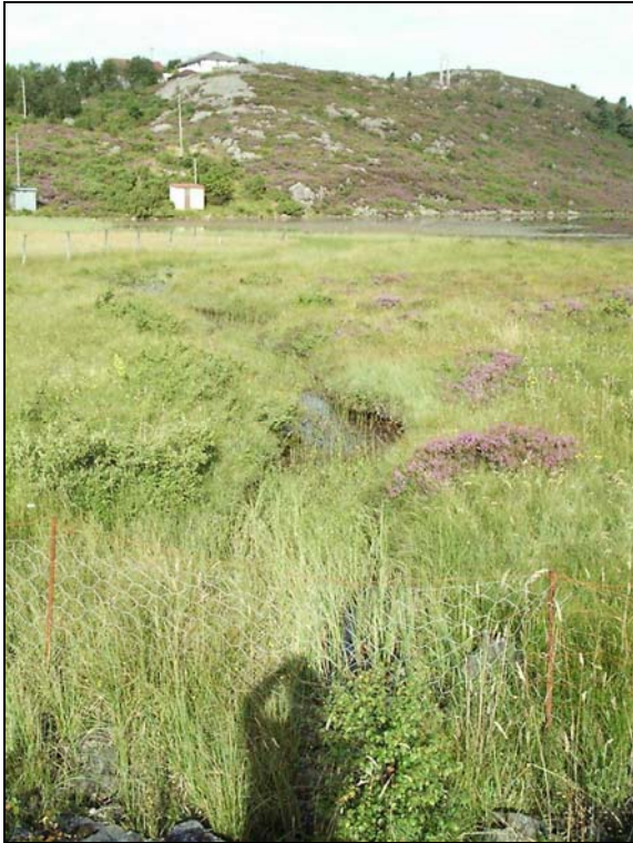
Figur 6. Bekk inn til Ebbesvikvatnet.