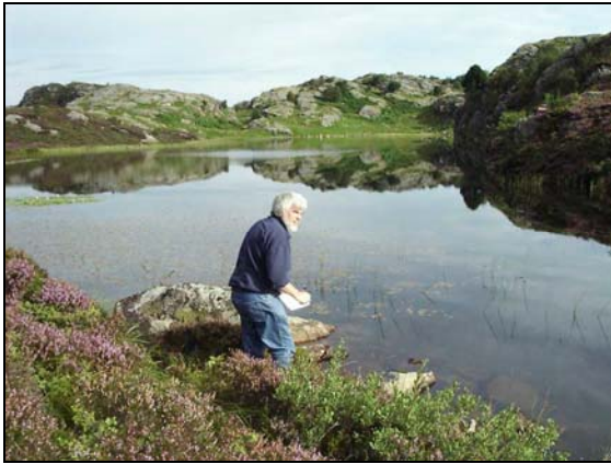
Figur 2. Sauavatnet.