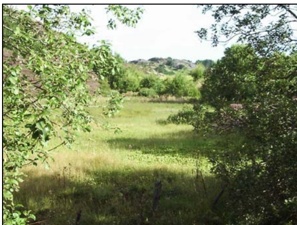
Figur 4. Myrområde nedenfor deponi.