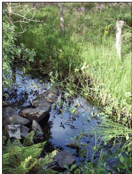
Figur 5. Prøvetakingssted nedenfor deponi.