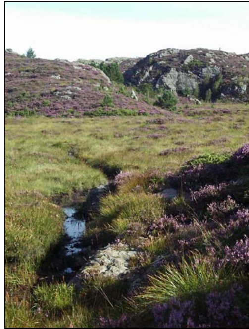
Figur 3. Bekk fra Sauavatnet ned mot deponi.