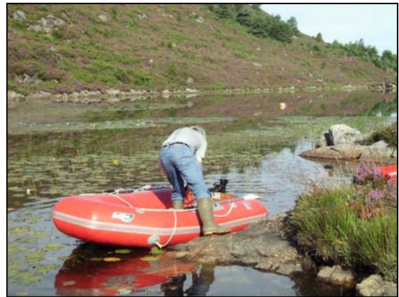
Figur 7. Ebbesvikvatnets søndre del.