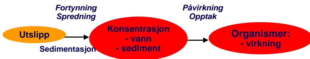
Figur 3. Prinsipp-skisse av elementene i en konsekvensvurdering.

Undersøkelsens Fase 2 inkluderer undersøkelser av vannutskiftning, vannkvalitet og organismesamfunn på grunt vann og vil dermed dekke opp denne mangelen på data. For prosjektets Fase 1 er imidlertid dette et problem og konklusjoner/anbefalinger bør derfor ansees som foreløpige.