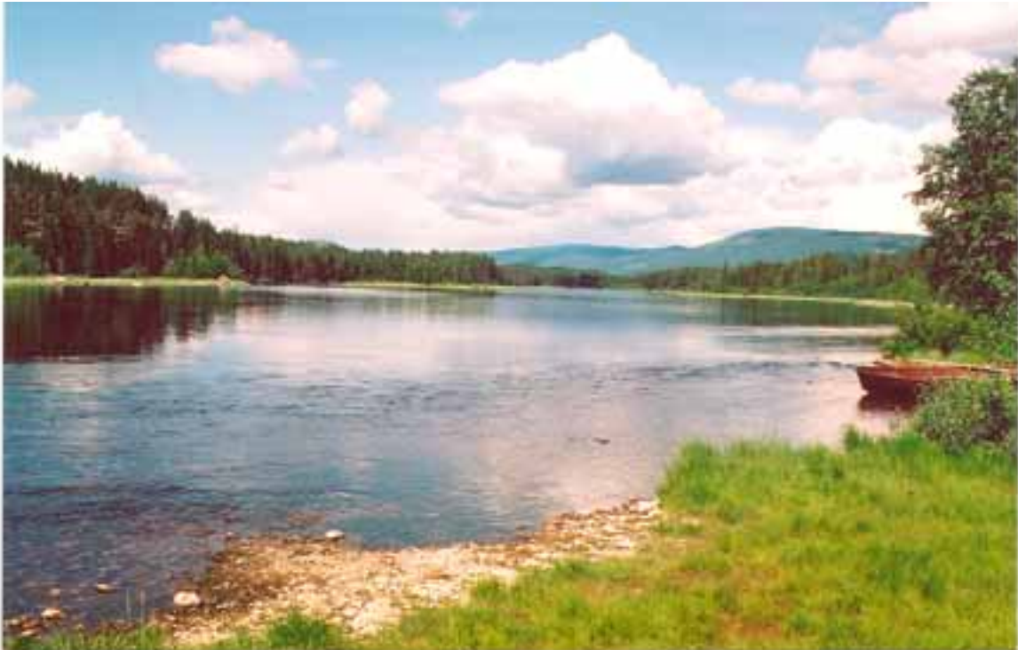
Renaelva, et sentralt vassdrag med tilknytning til Regionfelt Østlandet. Bildet er tatt ved Flåtestøa, like før samløp med Søre Osa og ca. 4 km nedstrøms planlagt oversettingsområde (OVAS) for Ingeniørvåpenet.