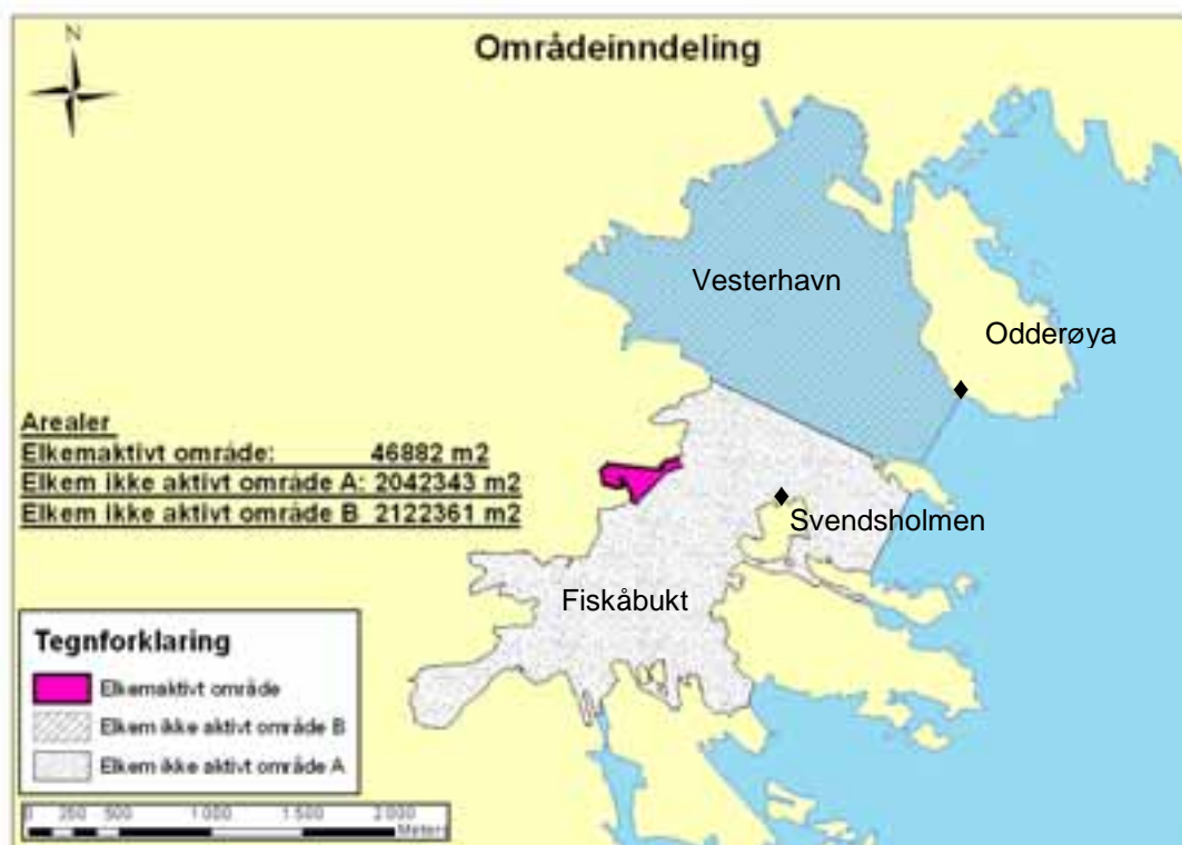
Figur 1. Kart over "Elkem-aktivt"- og "Elkem ikke-aktivt"- område (Fiskåbukta og Vesterhavn). ♦ = blåskjellstasjoner i JAMP-programmet.

Risikoen i "det Elkem-aktive området" kan være knyttet til: