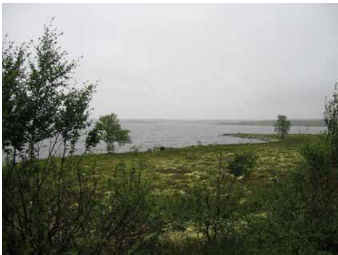
Flensjøen den 9. august 2005

Undersøkelse av vannkjemi, dyreplankton og bunndyr før kalking