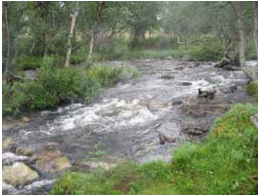
Figur 2. Prøvelokaliteten for bunndyr i utløpselva.

Bunndyrsamfunnet i utløpselva til Flensjøen (Fig. 2) var langt rikere på arter og individer enn strandsonen i sjøen (Tabell 4-5). Dette er en vanlig situasjon. Fjærmygglarver dominerte faunaen med forholdsvis høy tetthet. Av andre viktige bunndyrgrupper var steinfluer og vårfluer vanlige. Tettheten av døgnfluer var derimot forholdsvis lav. Døgnfluefaunaen bestod utelukkende av arten Baetis subalpinus (Tabell 5). Arter av slekten Baetis regnes generelt å være ganske forsuringfølsomme. Noen arter tolererer imidlertid noe surt vann, særlig i lokaliteter med høyt humusinnhold. Denne lokaliteten har ikke høyt humusinnhold, og den har lav ANC (se kapittel 2.1). Baetis subalpinus er det begrenset kunnskap om. Noen svenske undersøkelser angir at den kan finnes i vannforekomster med pH ned til 5,0, altså moderat følsom, mens Raddums indekser angir at den er meget følsom. Døgnfluer av slekten Baetis ble ikke påvist i 1998 (Kjellberg mfl. 2000). Steinfluefaunaen bestod av minst 6 arter der små ubestembare individer av slekten Amphinemura dominerte. Amphinemura -arter er meget forsuringstolerante. Av de andre steinflueartene var Diura nanseni den vanligste. Den tolererer en del forsuring, men forsvinner ved meget surt vann. Vårfluefaunaen besto av minst 3 arter, alle fra familien Polycentropodidae. De vanligste var små ubestembare individer av denne familien samt større individer av Polycentropus flavomaculatus . Alle er forsuringstolerante.