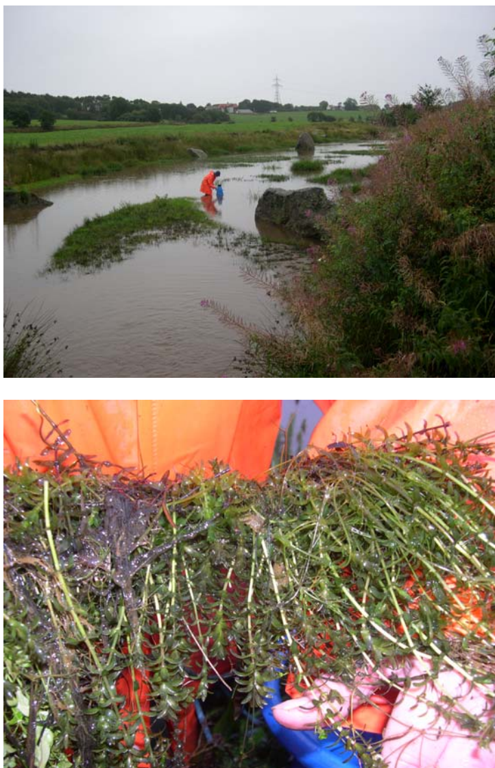
Figur 2. Skas-Heigre-kanalen ved Soma september 2006. Det var fortsatt store mengder vasspest på lokaliteten (nederst) selv om bestandene ikke var synlige i overflata.