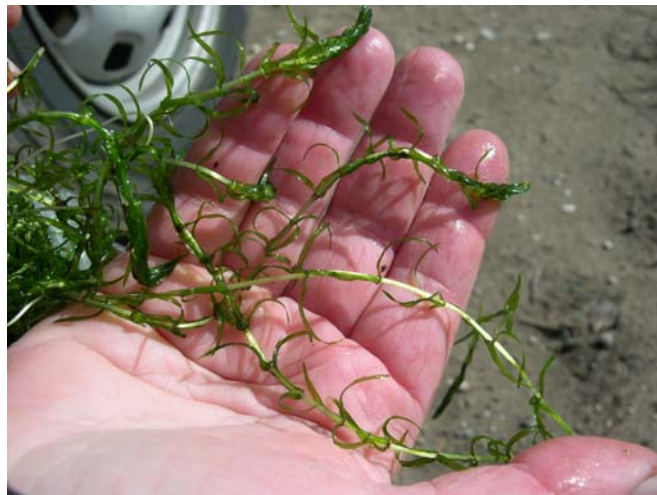
Figur 4. Smal vasspest ( Elodea nuttallii ) fra Bjårvatn, september 2006. Foto: Svein Dam Elnan, Fylkesmannen i Rogaland).