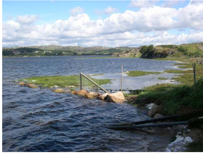
Figur 3. Sørvestre del av Bjårvatn, september 2006.