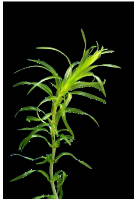
Vasspest, Elodea canadensis og Smal vasspest, Elodea nuttallii