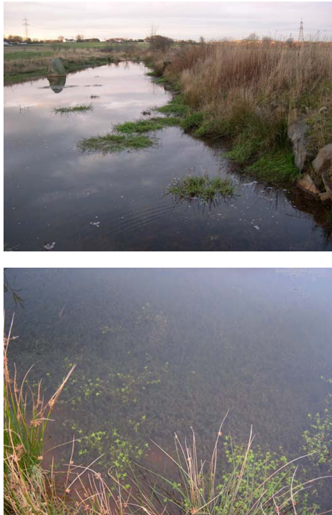
Figur 1. Vasspest i Skas-Heigre-kanalen ved Soma 8. desember 2005. Store bestander med vasspest like under overflata kunne sees fra land (nederst).

I kanalen ved pumpestasjonen ble vasspest ikke registrert. Det tas imidlertid forbehold når det gjelder små forekomster eller enkeltskudd da sikten var svært dårlig og vannstanden høy. Vannvegetasjonen var for øvrig dominert av Potamogeton -arter (tjønnaks-arter).