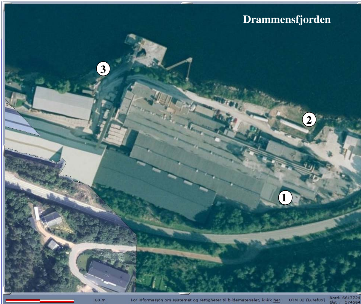
Figur 2. Norgips Norge AS sett fra luften. Prøvetakingspunkter er merket 1 – 3. Punktene 2 og 3 markerer utslippene til Drammensfjorden.