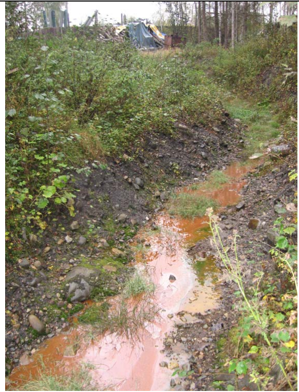
Figur 5. Metallholdig sig ved bildemontering 26.9.06.