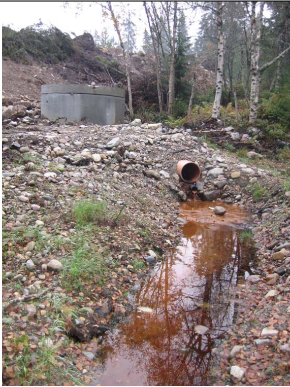
Figur 4. Restutslipp til Bjørnbekken ved Budor 26.9.