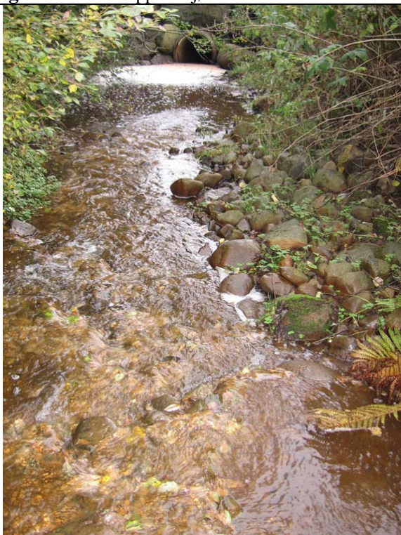
Figur 6. Begroing i Bergsengbekken 26.9.2006.