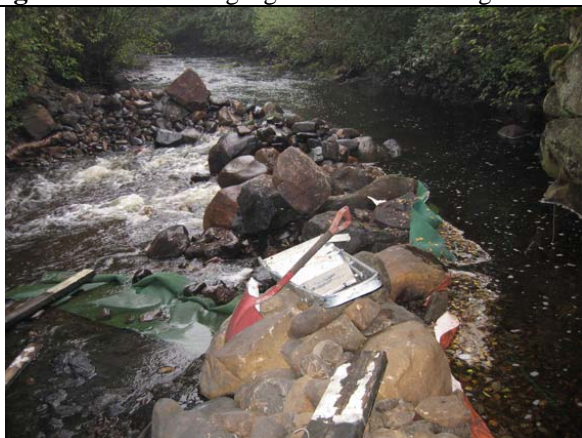
Figur 7. Sjøppel i Fura, nedstrøms samløp Vingerjessa