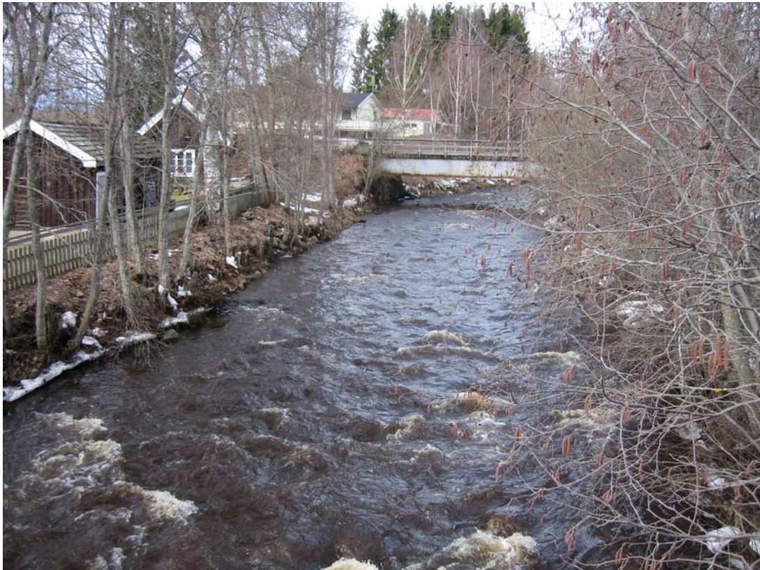
Fura ved Haukstad (st. 6) 18.4.2006