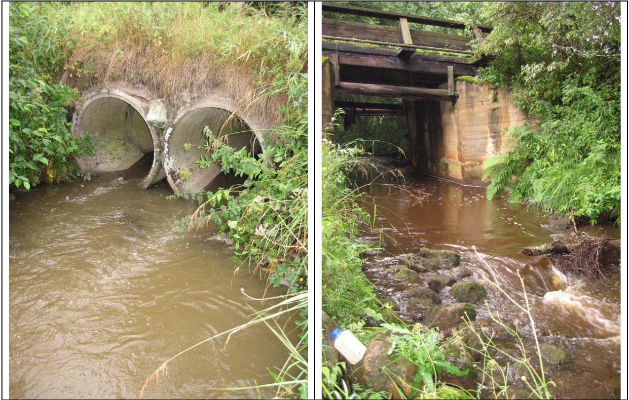
Figur 2. Vingerjessa ved regnvær 15.8.2006. Til venstre: st. 7, nedstrøms Jønsrud. Til høyre: st. 9, nedstrøms Løten sentrum.