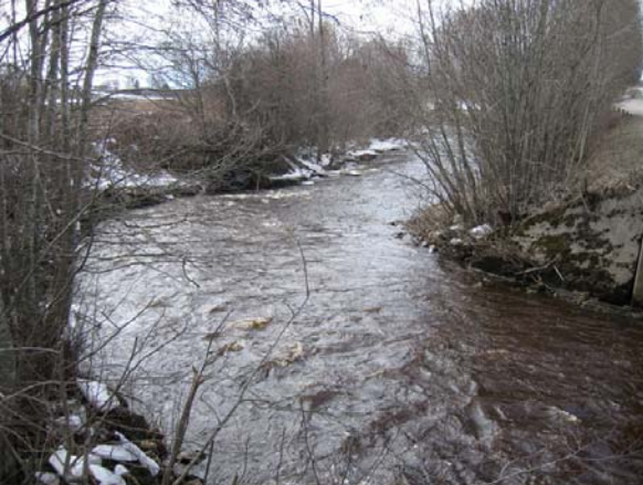
Figur 8. Fura ved st. 6 (ved Haukstad) 18.4.2006.