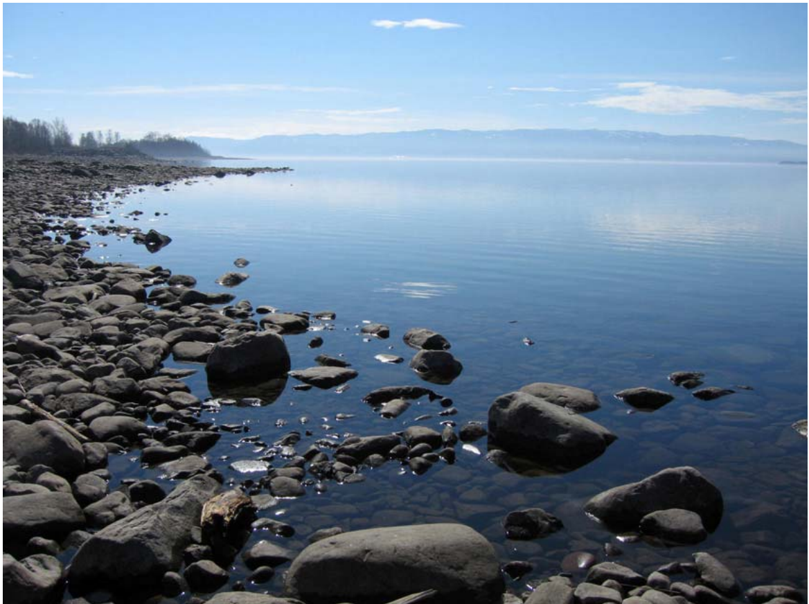
Mjøsa utenfor HIAS, april. 2007.

Undersøkelser og vurderinger av inntakssted i Mjøsa i 2007