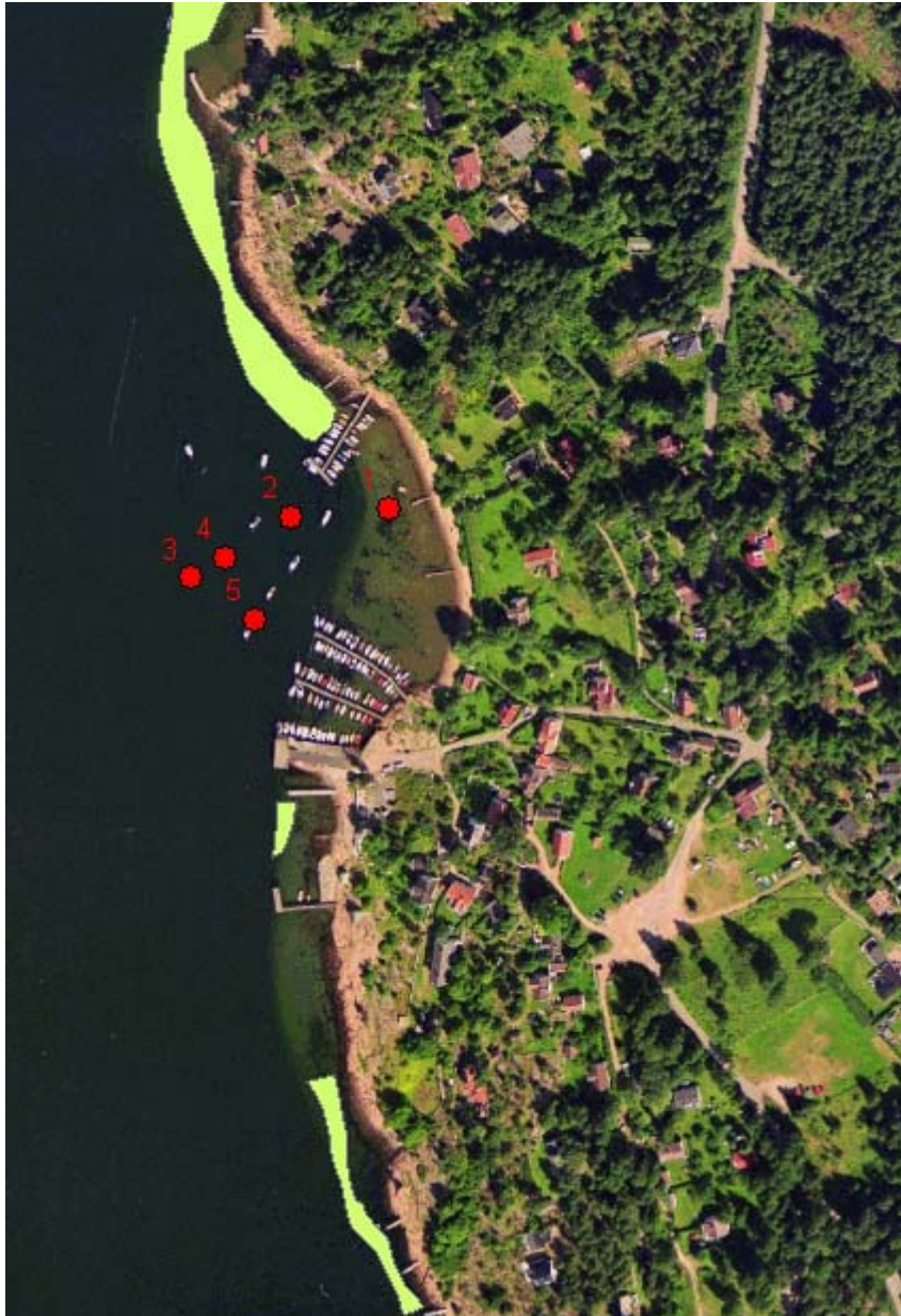
Figur 2. Oversikt over registrerte ålegrasenger i området (lysegrønne felter), og hvor det ble foretatt grabbprøver (røde punkter). Målestokk 1: 4000.

Arealet til den tidligere registrerte ålegrasengen i nord var 5 600 m 2 . Den minste ålegrasforekomsten var 200 m 2 , den sørligste ca 1000 m 2 .