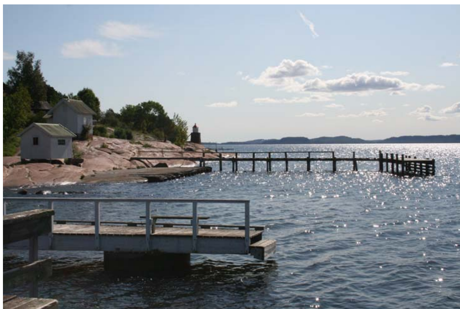
Figur 3. Ålegrasengen som ble observert inne i reguleringsområdet ligger på innsiden av de to bryggene

Det ble observert en middels stor ålegraseng (ca 1000 m 2 ) omtrent 50 meter syd for båthavnas reguleringsområde. Også her var det rik vegetasjon med moderat vekst av trådformede alger. Engen var nokså smal, kun ca 3 meter bred. Bunnen er forholdsvis skrånende, slik at dybden begrenser engens ytre voksegrense.